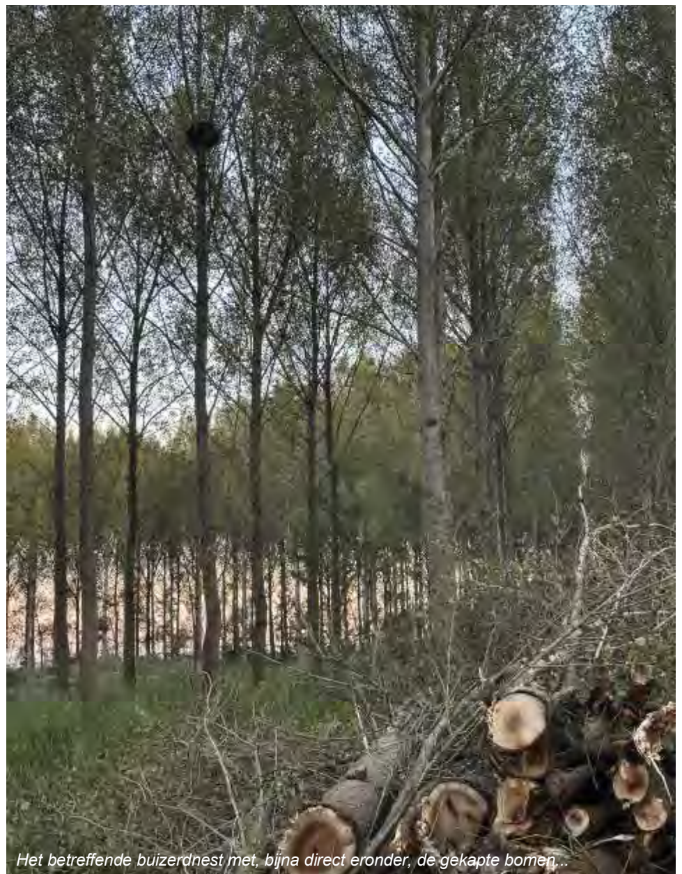
Het betreffende buizerdnest met, bijna direct eronder, de gekapte bomen...

Het buizerdnest is beschermd onder de wet, die stelt dat niet alleen het nest zelf, maar ook de zoge-