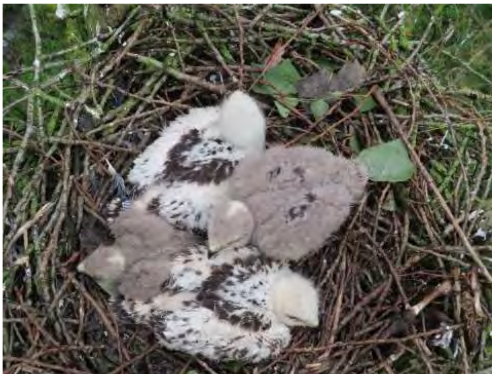
4 mooie, jonge buizerdkuikens op het bedreigde nest. De buizerds zijn begin juli uitgevlogen...

De goedkeuring voor de kap was gebaseerd op een ecologisch onderzoek dat naar onze mening ernstige tekortkomingen vertoont. Het