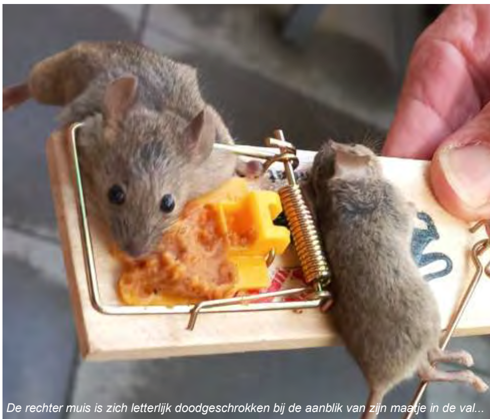
De rechter muis is zich letterlijk doodgeschrokken bij de aanblik van zijn maaije in de val...

En wat ik nu ga zeggen, zal veel mensen tegen de borst stuiten: Ik heb een paar ouderwetse muizen- vallen gekocht, ingesmeerd met