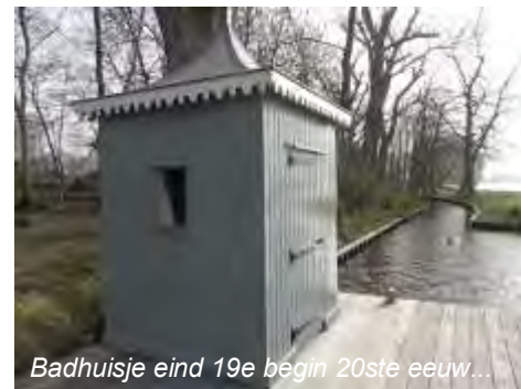
Badhuisje eind 19e begin 20ste eeuw...

vraag of hij zijn buitenhuis beschikbaar wilde stellen voor de opvang van Duitse Joodse kinderen die via de stichting jeugd-Aliya vanuit Duitsland naar Nederland waren gekomen. In totaal zijn er 51 Duits Joodse kinderen op het Hof van Moerkerken geweest. 25 van hen zijn voor de Duitse bezetting van Nederland naar Palestina geëmigreerd. Na het uitbreken van de oorlog werden de kinderen die toen nog op het Hof verbleven in augustus/september 1940 naar een opvanghuis in Loosdrecht gebracht. Tijdens de Tweede Wereldoorlog was een herstellingsoord voor tuberculosepatiënten gevestigd in het hof.