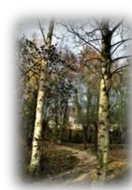
Berken spelen in Oekraïne een rol in de folklore en in de sauna. "Berjesa" - berk...

bleek met de kinderen op zoek te willen naar eetbare planten en paddestoelen. Uiteraard probeerde ik haar uit te leggen dat de heemtuin niet in de eerste plaats daarvoor