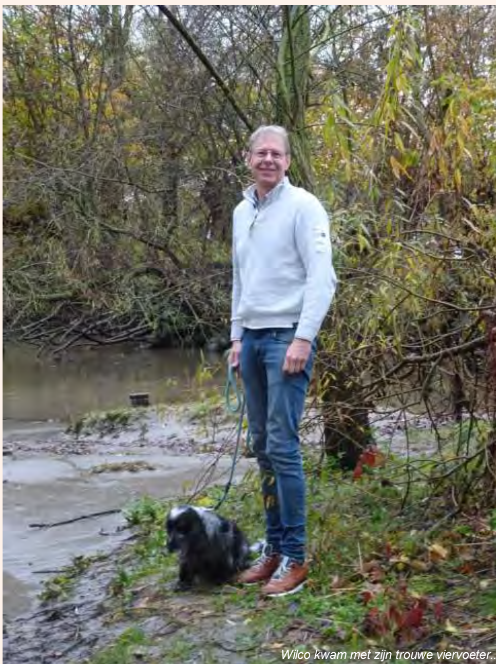
Wilco kwam met zijn trouwe viervoeter...

“Als lid kun je een bijdrage leveren naar draagkracht!”