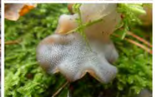
Vlnr: Violette gordijnzwam, Boompuijt, Kastanjeboleet, Paarse knoopzwam, Stekeltrilzwam (IJSzwammetje)