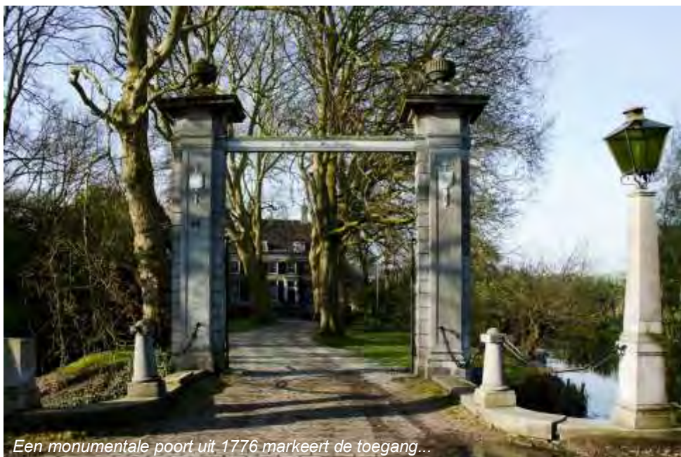
Een monumentale poort uit 1776 markeert de toegang...

van Monumentenzorg. Een landschapspark is bij het Hof van Moerkerken, deze is ommuurd heeft een kouwe bak (planten of groenten) en een druivenkas. Dit dient het rustgevend landschap.