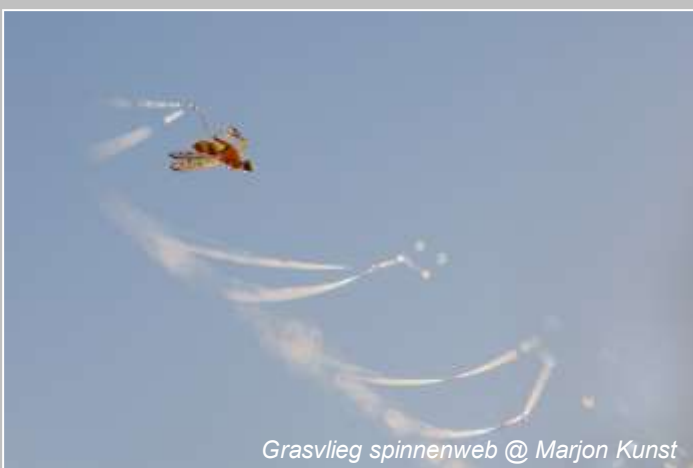
Grasvlieg spinnenweb @ Marjon Kunst

Belangrijk bij natuurfotografie is 'kijken': wat is interessant om te fotograferen en hoe kun je het onderwerp het beste in beeld brengen? In de cursus besteden we aandacht aan het maken van een goede compositie. Ook de techniek van fotograferen komt uitgebreid aan bod. We sluiten de cursus af met tips en trucs voor het fotograferen van landschappen en het maken van macrofoto's en close-ups.