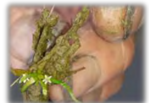
Door het explosieve karakter van de Kleine waterteunisbloem verdwijnen andere bijzondere soorten, zoals b.v. Slijkgroen foto hierboven ( Limosella aquatica L.).