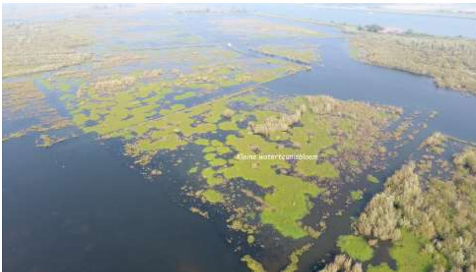
Dronefoto van Weelde Oost. Goed zichtbaar zijn de dichte vegetatiematten van de Kleine waterteunisbloem ( Ludwigia peploides ).

Invasieve exoten zijn dieren of plantensoorten die niet van nature in Nederland voorkomen en door menselijk handelen in onze natuur zijn terechtgekomen. Deze soorten zijn een bedreiging of schadelijk voor de inheemse soorten. In Europa geldt een verbod op bezit, handel, kweek, transport en import van deze exotische planten en dieren. Ze staan op de zogenoemde Unielijst. Van deze lijst komen o.a. de Kleine waterteunisbloem, Reuzenbalsemien, en de Reuzenberenklauw in de Hoeksche Waard voor.