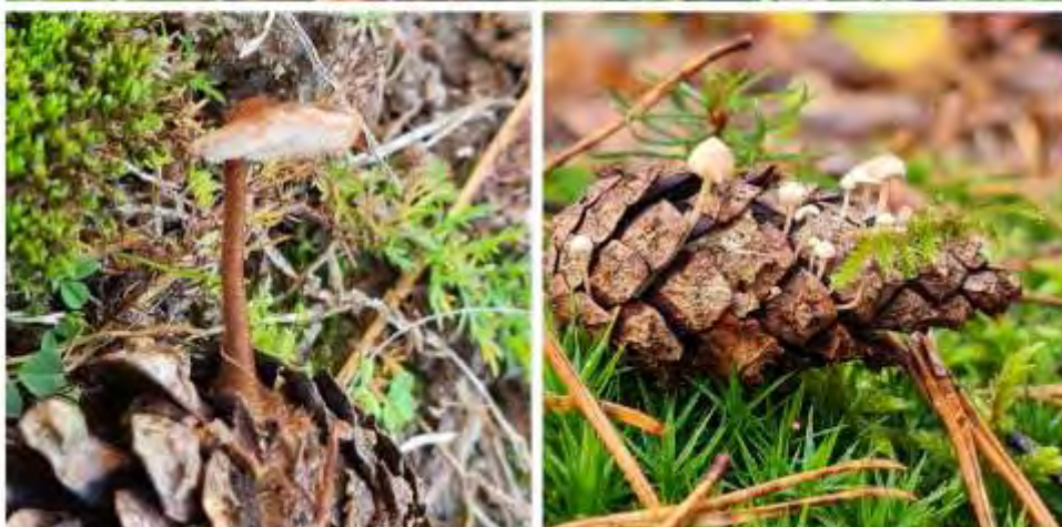
Vlnr: Geel nestzwammetje, Oorlepelzwam en Muizenstaartzwam.