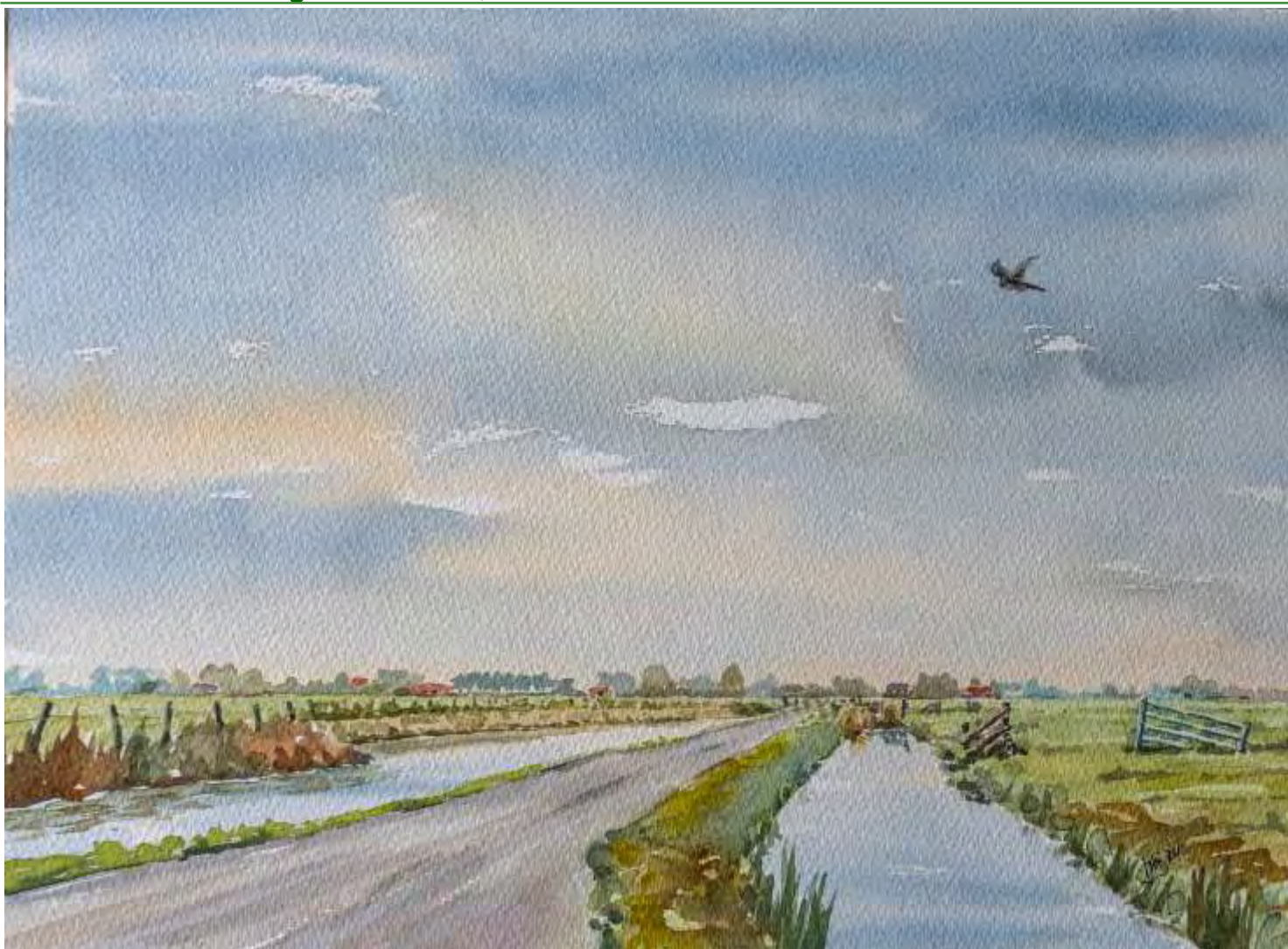
Afm.: 26 x 36 cm

Deze keer heb ik gekozen voor het Oudeland van Strijen. Het gebied heeft prachtige kreken en sloten met karakteristieke bruggen. Dit uitgestrekte natuurgebied is ook geliefd en van groot belang bij veel gevleugelde wintergasten.