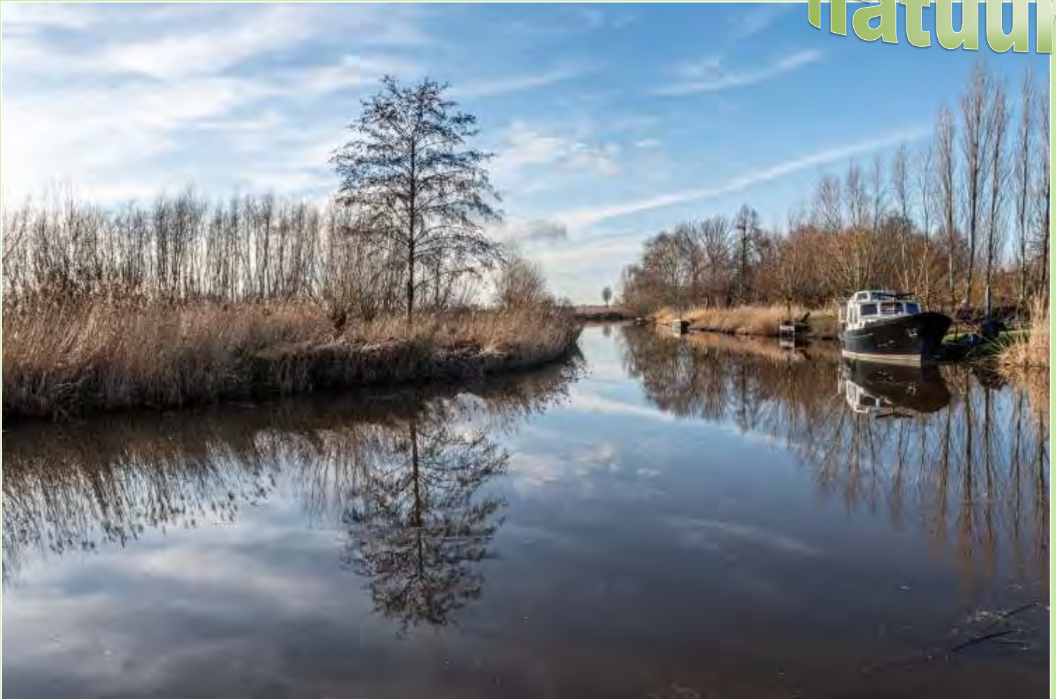
Nieuwe Haven, Strijen