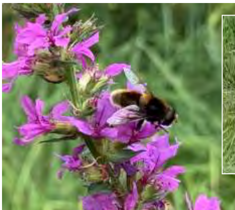
Stuifmeel en nectar als gifdrager...

schappelijk onderzoek toont het dodelijke effect op bijen, waterinsecten, vissen en vogels aan. Zo maakt de Wageningen Universiteit in een recente publicatie het resultaat bekend van 50 wereldwijde studies naar het effect van neonics op 12 vogelsoorten. Vrijwel elk aspect van het vogelleven wordt negatief beïnvloed. Verminderde oriëntatie waardoor ze op de trek de weg kwijtraken, afwijkingen bij de jongen en korter leven zijn onder andere de gevolgen. Uit een Zwitsers onderzoek komt naar voren dat de stoffen ook in de hersenen, het bloed en de urine van jonge