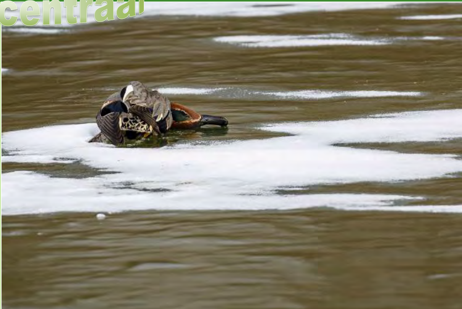
Wintertaling © Marjon Kunst