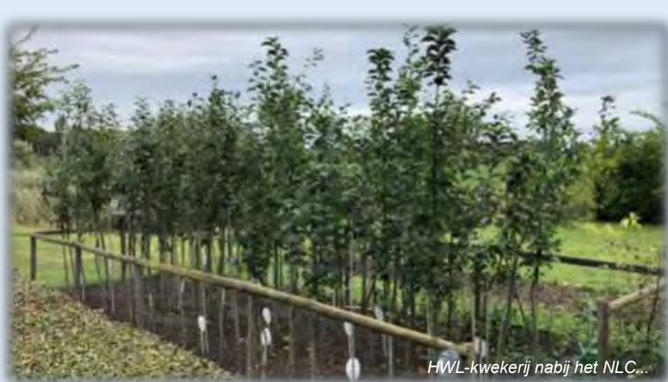
HWL-kwekerij nabij het NLC...

Behalve dergelijke technische innovaties in de professionele fruitteelt