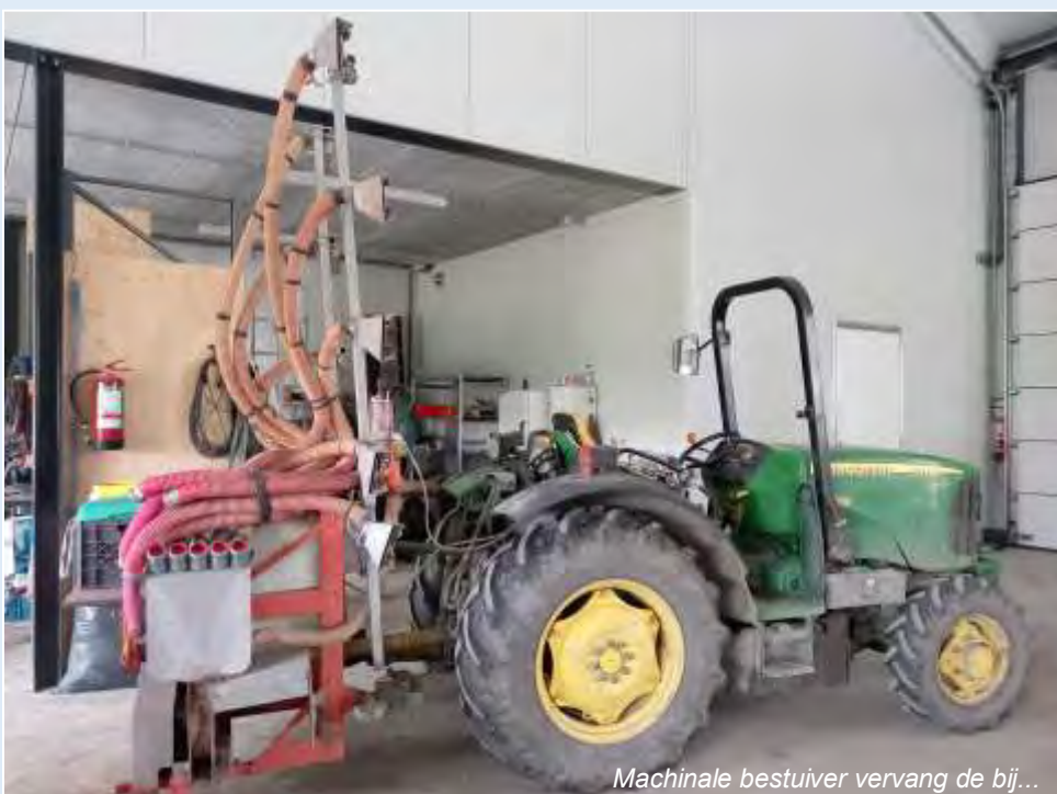
Machinale bestuiver vervangt de bij...