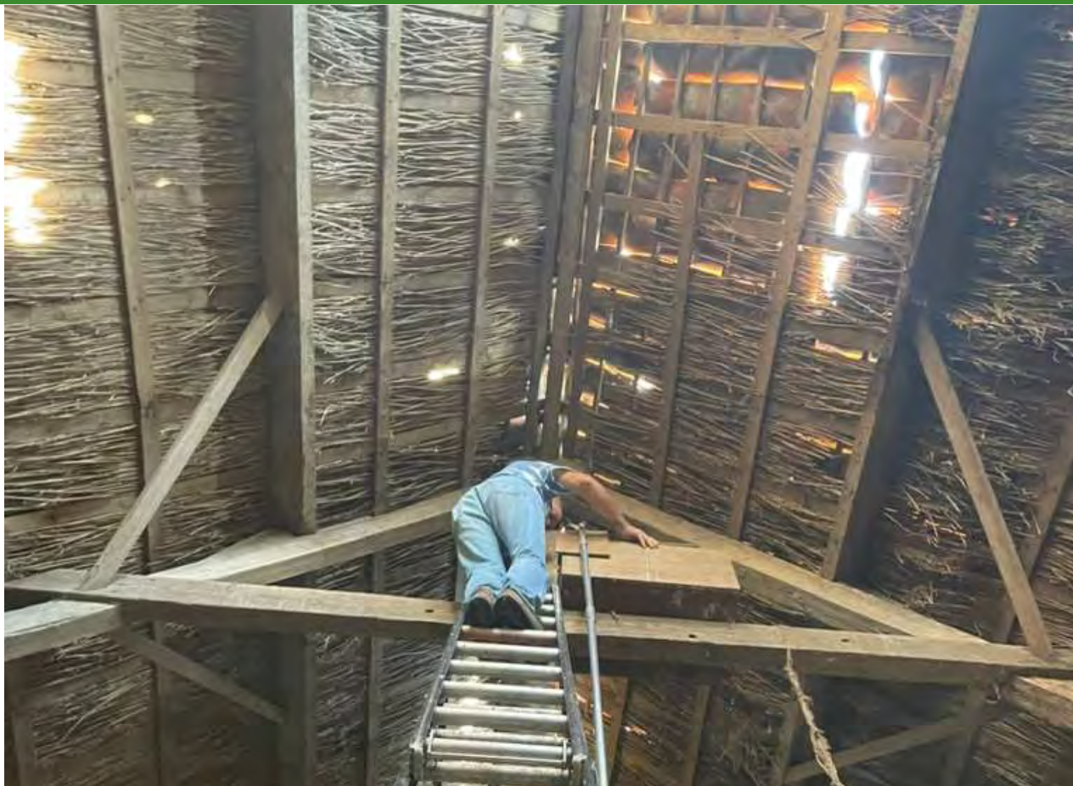
Aantal jonge uilen Hoeksche Waard