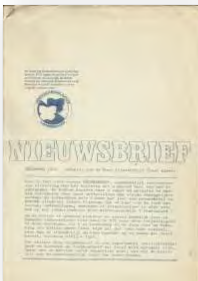
De eerste uitgegeven nieuwsbrief...