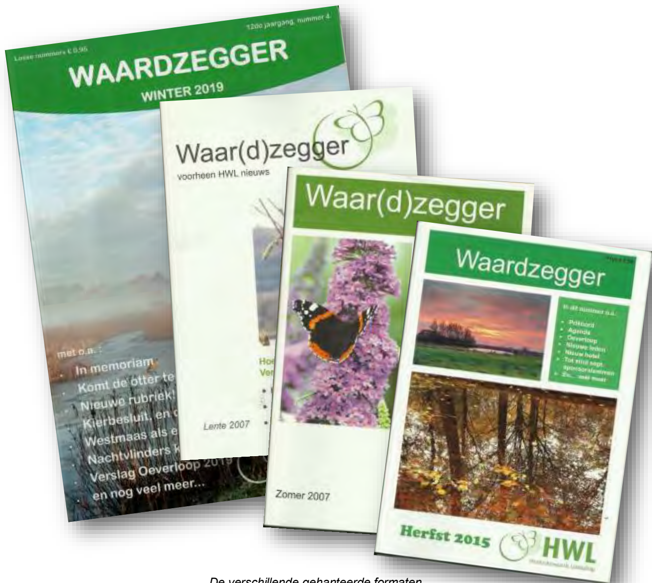
De verschillende gehanteerde formaten...

uiteindelijk de keuze voor een sprekende lay-out.”