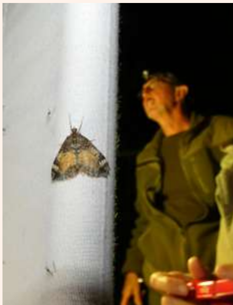
Schimmelspanner, op Klein Profijt

Vroeger werden de waarnemingen bij iemand privé van de werkgroep in een bestand gezet.