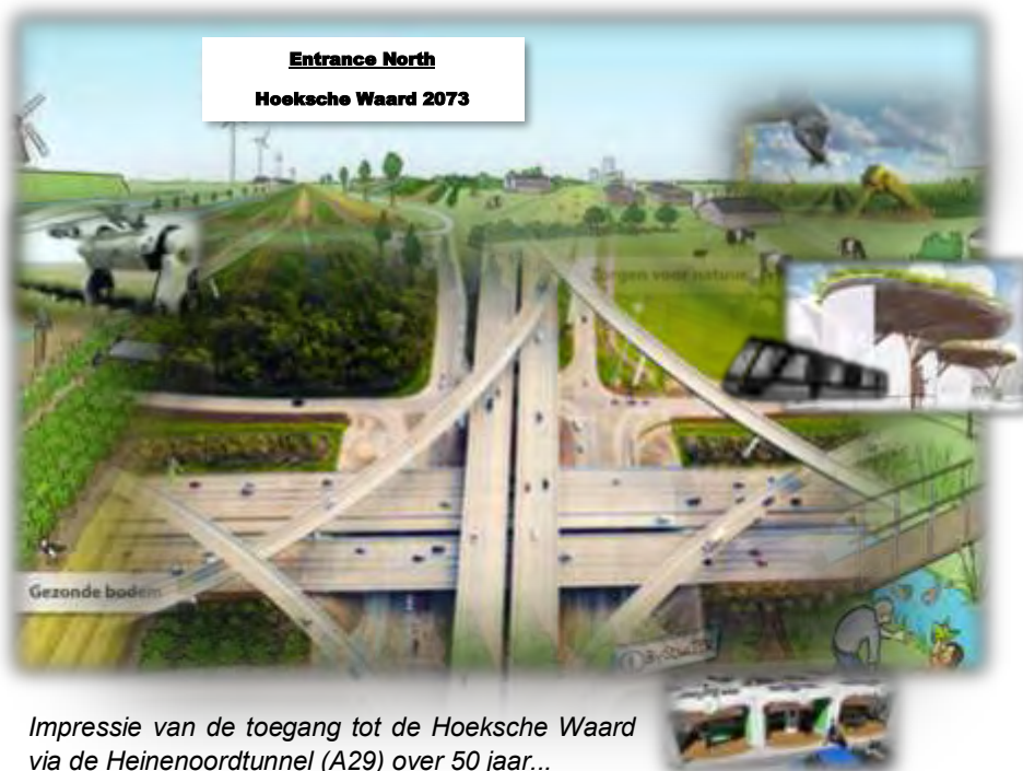
Impressie van de toegang tot de Hoeksche Waard via de Heinenoordtunnel (A29) over 50 jaar...