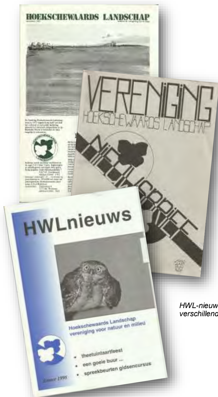
HWL-nieuwsbrief in de verschillende uitvoeringen