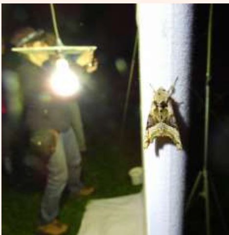
Agaatvlinder, Heemtuin te Piershil

De tellingen van dag- en nachtvlinder en libellen werden daarin bijgehouden. Deze waarnemingen waren niet door anderen raadpleegbaar. Nu hebben we afgesproken deze allemaal op Waarneming.nl te verwerken. Wanneer je een account aanmaakt, zijn alle waarnemingen raadpleegbaar. Ook kun je deze inzien alleen voor de Hoeksche Waard op: