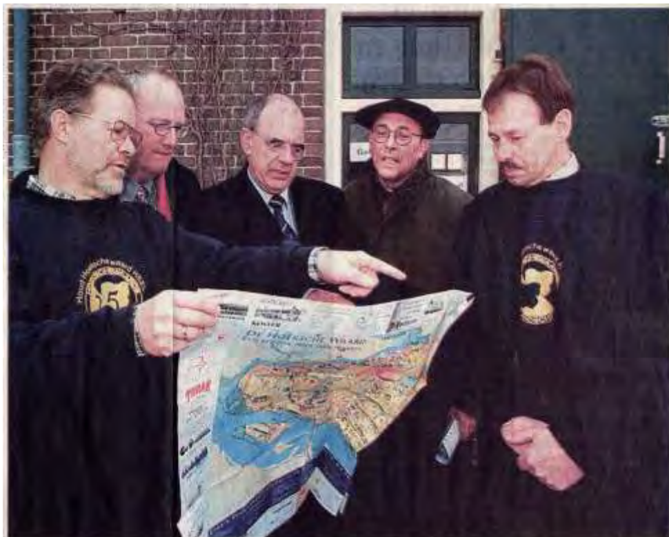
Minister Pronk tijdens een werkbezoek aan de Hoeksche Waard in 1999. Pronk krijgt in Oud-Beijerland tekst en uitleg over Hoeksche Waard door mensen van het Hoekschewaards Landschap.

Vanwege de beschikbare ruimte in deze jubileumuitgave zijn alleen de belangrijkste gebeurtenissen vermeld.