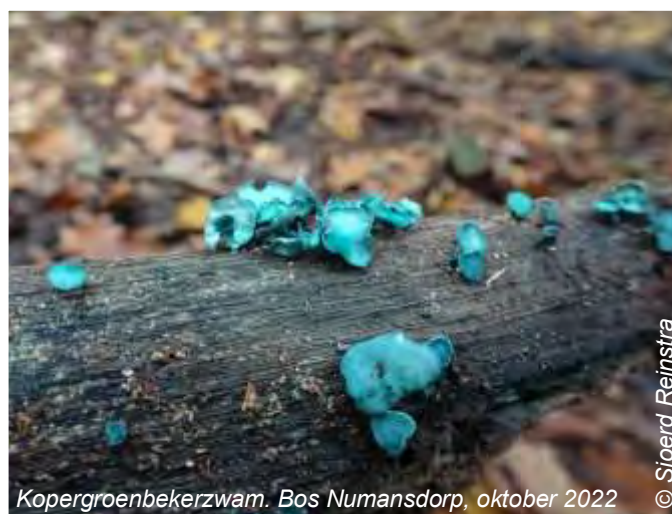
Kopergroenbekerzwam. Bos Numansdorp, oktober 2022