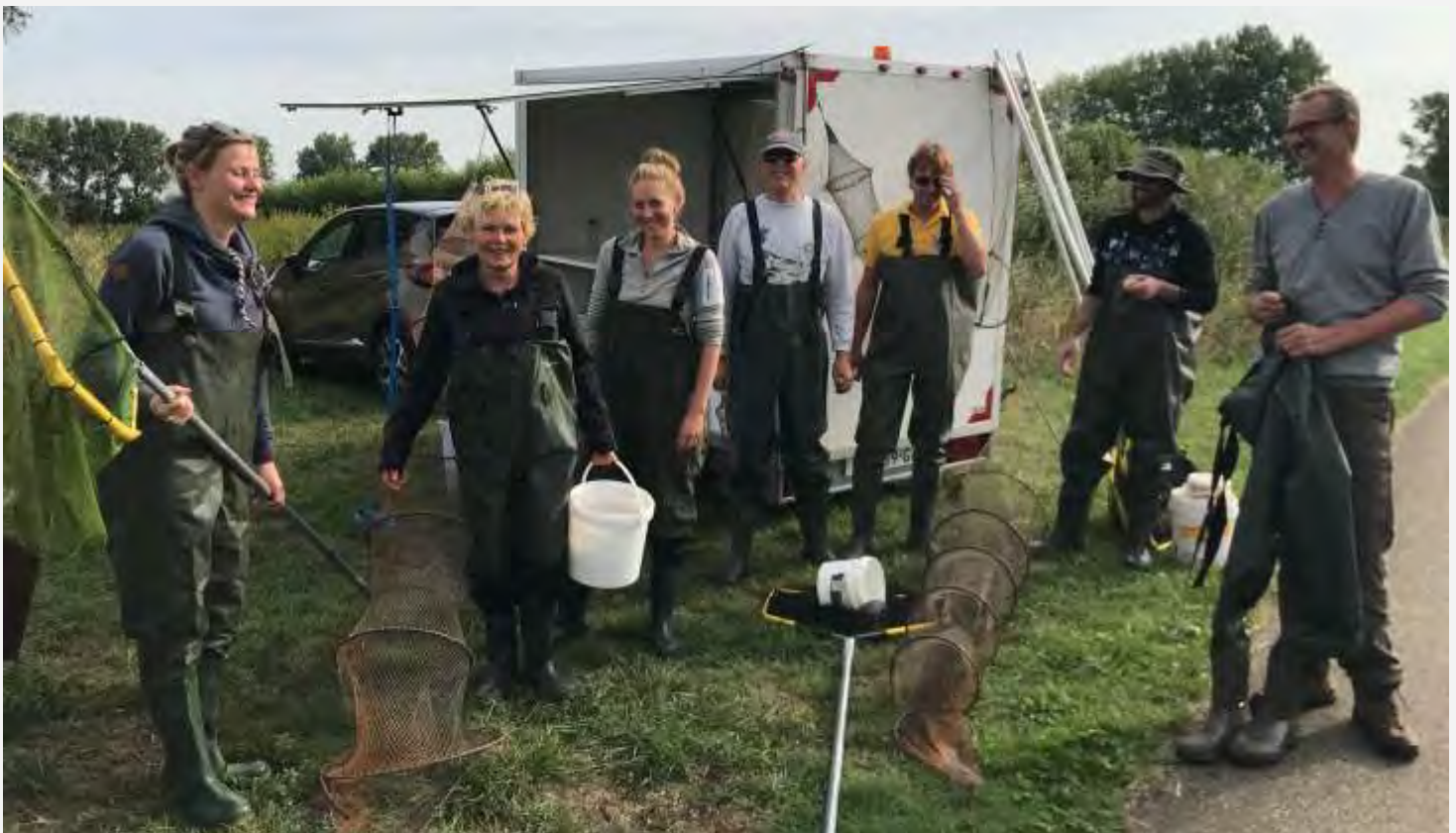
Leden van de aquatische werkgroep "de Modderkruipers" actief op Tiengemeten...