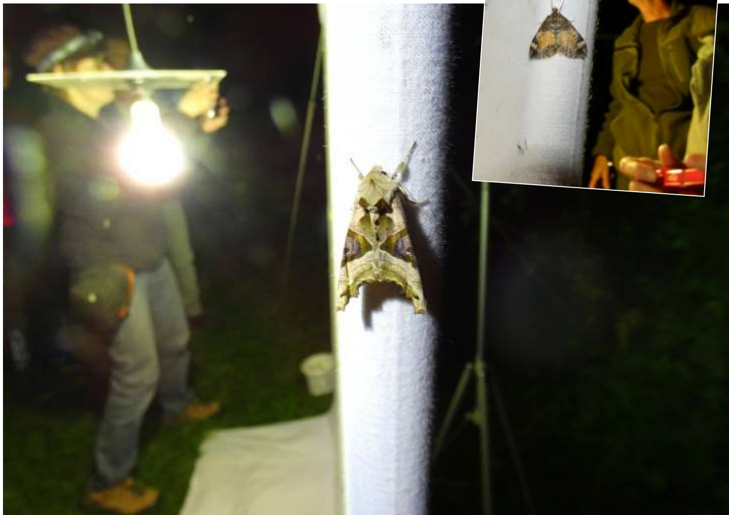
Agaatvlinder (grote foto), Heemtuin te Piershil Schimmelspanner (inzet), op Klein Profijt