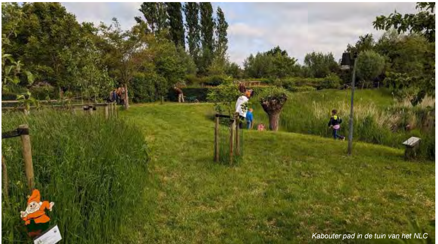
Kabouterspad in de tuin van het NLC

We knutselen wat af ook, de opdrachten behoeven hier en daar toch ook de nodige hardware om