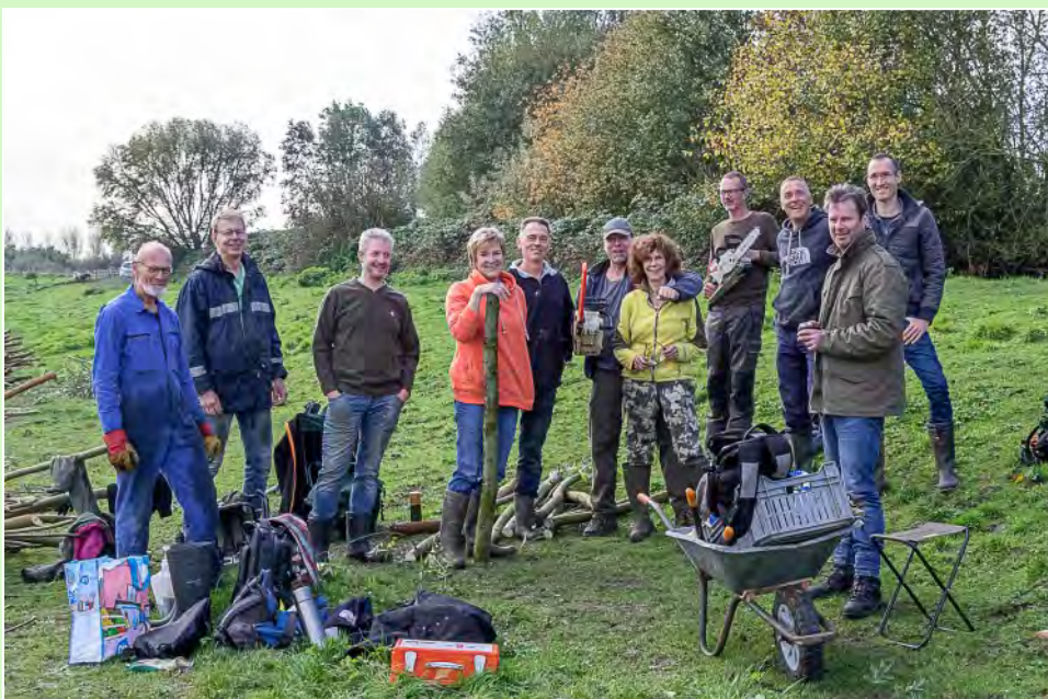
Een zeer kleine selectie van onze enthousiaste vrijwilligers: knotploeg De Knotvogels...