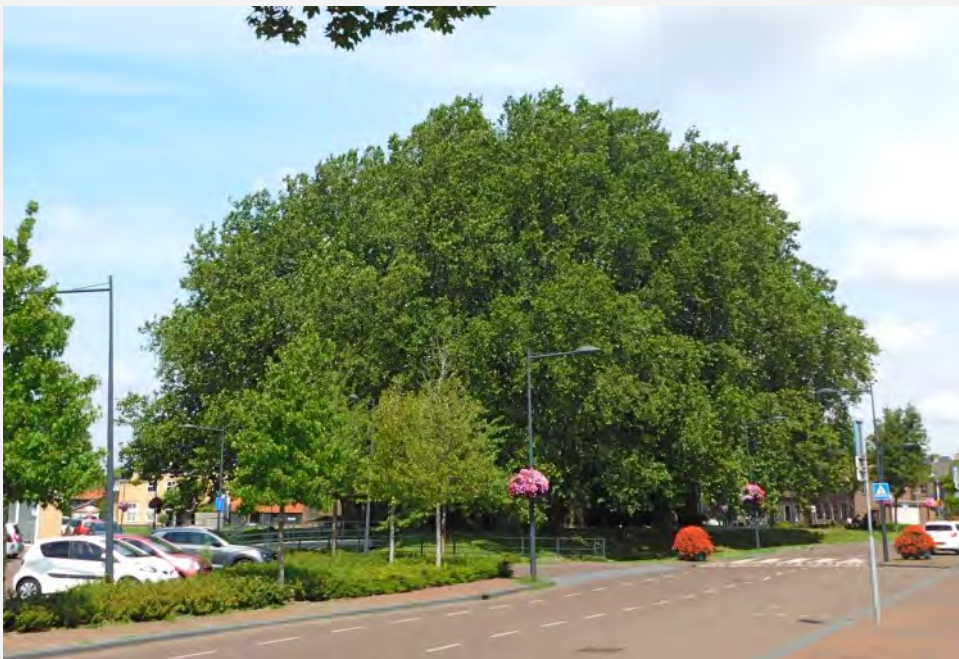
Ook de monumentale platanen voor de Hervormde Kerk in 's-Gravendeel stonden weer helemaal in blad.

Elk nadeel heeft zijn voordeel en omgekeerd. Met dank aan Johan Cruijff kunnen we die wijsheid nu op heel wat zaken toepassen. Ook op bomen. En dan specifiek op hoe bomen reageren op totaal verschillende weertypen in het voorjaar. De gevolgen van het tot de tweede week van mei te koude en ook natte voorjaar waren voor sommige boomsoorten namelijk heel goed zichtbaar.