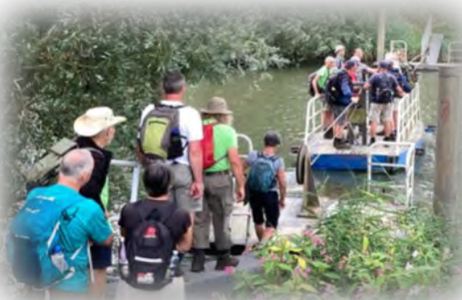
Oversteek met het trekpontje naar de Esscheplaat...

Het HWL laat tijdens de Oeverloop zien waar de kracht van de vereniging zit. Dat zijn de vele vrijwilligers, die het evenement mogelijk maken. Niet alleen de werkgroep, die de wandeling organiseert, maar ook de blarenprikkers, de vrijwilligers van de bargroep, die iedereen van een drankje voorzien en de leden van de kookgroep, die zorgen dat er elke dag een rijke lunch op locatie is. Dit keer bij twee boerde-