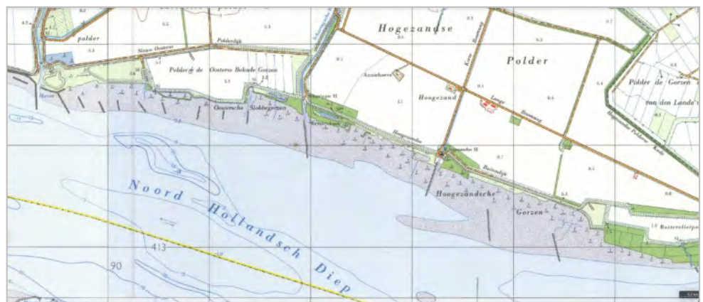
Gorzen 1970

Na de Oeverloop schreef HWL een brief naar het ministerie van LNV. Het ministerie gaf in de beantwoording aan dat al in 1988 besloten was tot aanleg van de oeververdediging, maar dar er een probleem was met medefinanciering door de Ambachtsheerlijkheid (toen nog onder eigen bestuur). Ook AMEV was, als latere eigenaar, niet van plan om mee te financieren. Ook was er onenigheid over het toekomstig gebruik van de gorzen. AMEV wilde de gorzen gebruiken als weidegebied, dit in tegenstelling tot het ministerie dat de gorzen als moerassige oeverzone wilde inrichten.