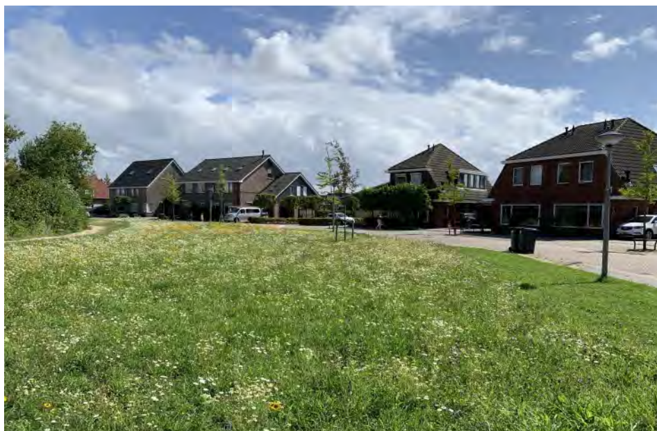
Gewild groen, Nieuw-Beijerland...

email kievitjoost@gmail.com , telefoon 078 6731522