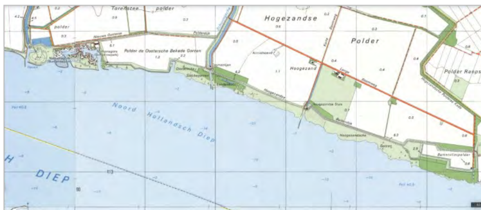
Gorzen 1996

Wordt vervolgd in de volgende Waardzegger