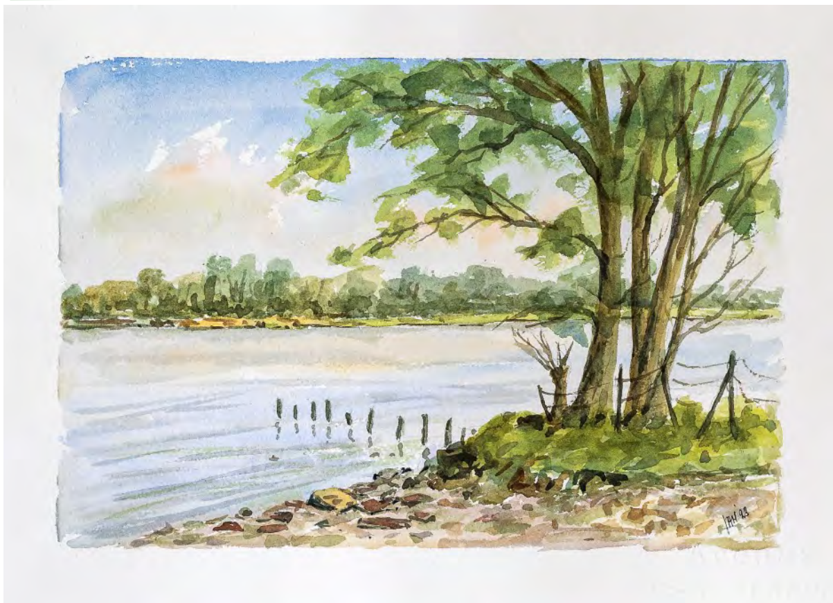
Afm.: 20 x 30 cm