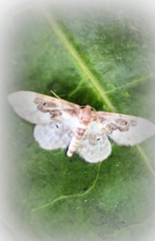
Schaduwstipspanner © Bart-Jan Baaijens