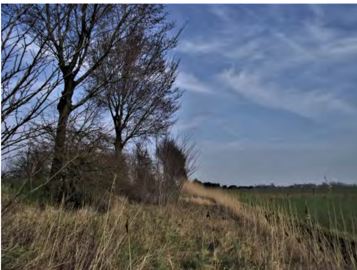
Ideaal talud met verspreide bomen, ruigten, kruiden...

worden naar het Rijk (Min. van LNV). Dat is gebeurd. Het staat inmiddels ook op onze site. Het voorontwerp wordt kritisch bekeken door het Rijk en door de onafhankelijke Ecologische Autoriteit. Daarna komt het terug naar de provincie en gaan allerlei partijen er nog eens naar kijken, HWL natuurlijk ook. Uiteindelijk moet het in maart 2024 definitief vastgesteld zijn door de Provinciale Staten. Daarna kunnen de provincies geld gaan aanvragen voor projecten en maatregelen. Dit alles onder voorbehoud in verband met de val van het kabinet. Zuid-Holland denkt voorlopig € 9 miljard nodig te hebben.