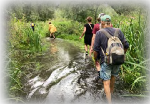
Laarzenpad dat Lieslaarzenpad werd...

“De bloemen in hun pracht langs elke flank, van levensaders in dit lage land bespiegeling van kant naar overkant Verbonden door een wie- belende plank.”