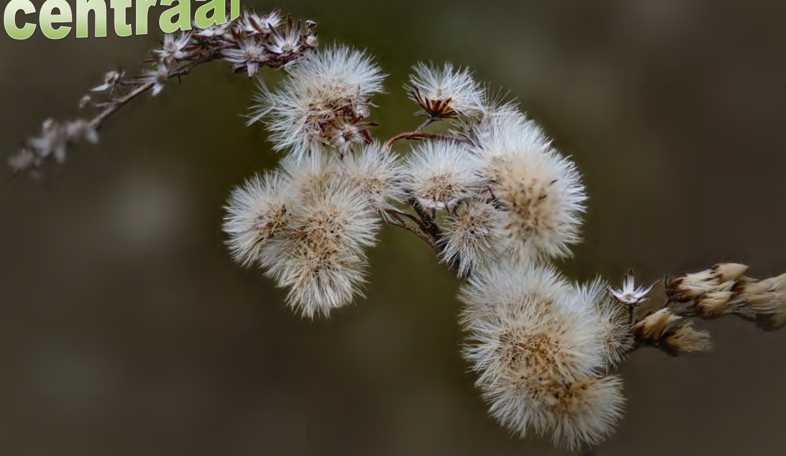
Zaadpluis Guldenroede