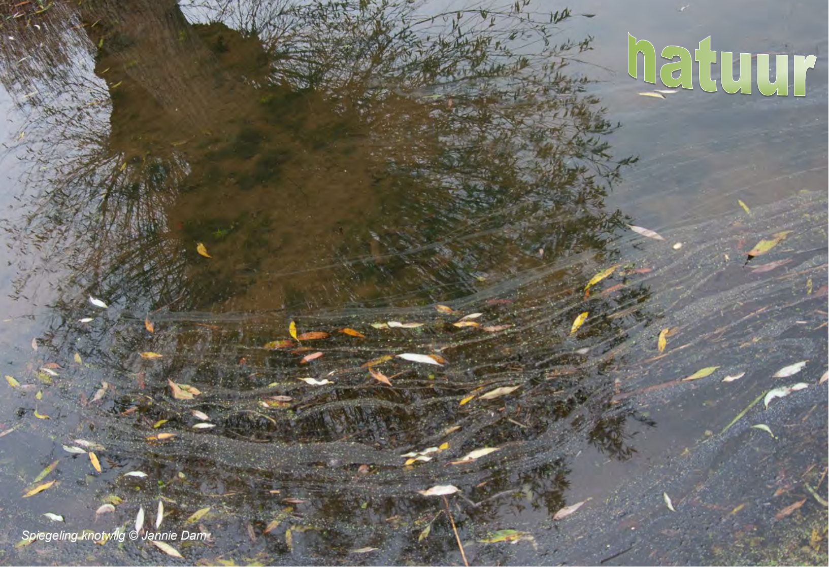
Spiegeling knotwilg