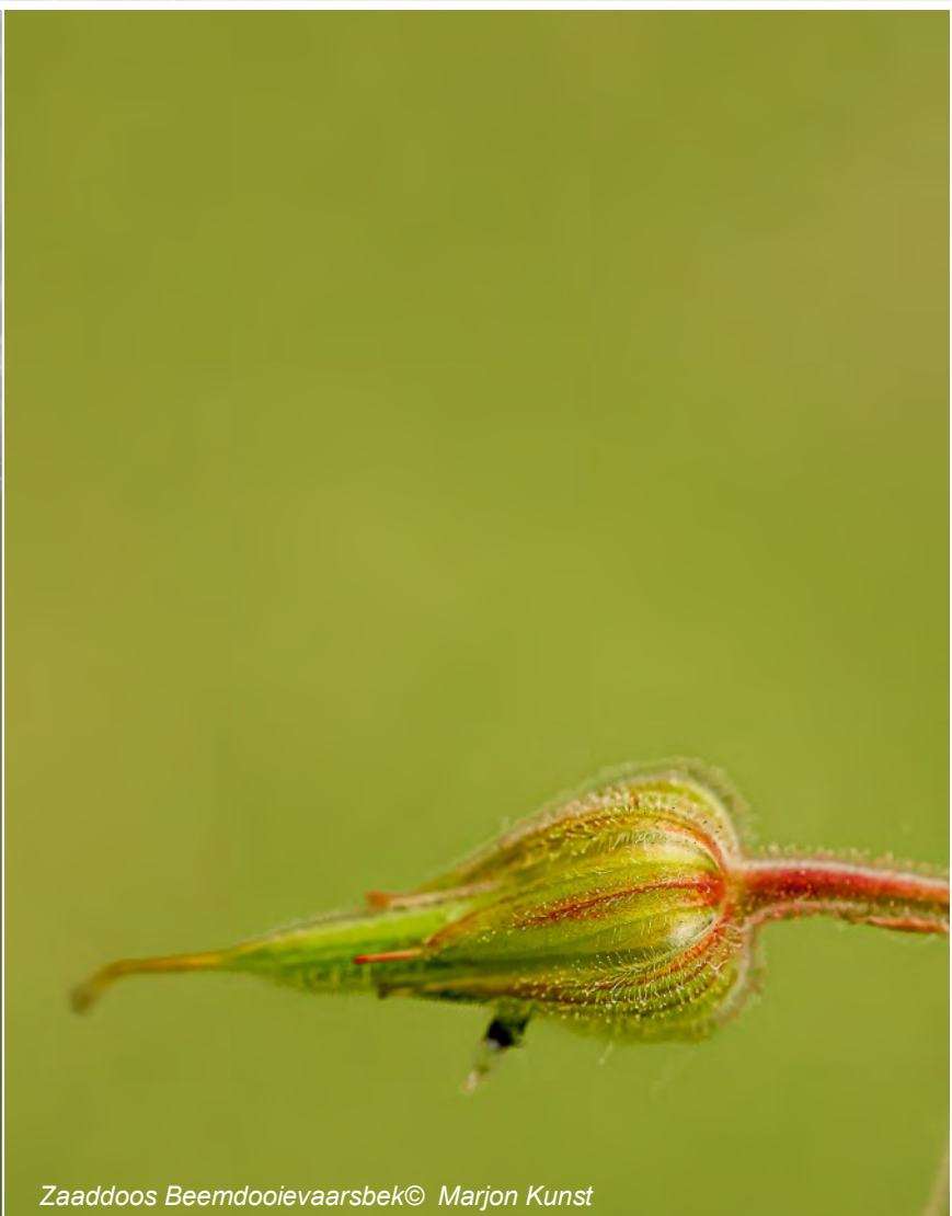
Zaaddoos Beemdoeivaarsbek © Marjon Kunst