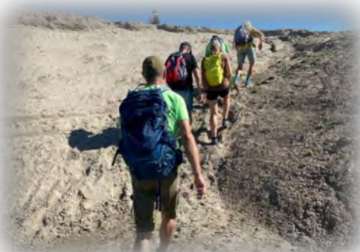
Een beklimming (!) in Puttershoek...

rijen en bij de natuurbegraafplaats. Op de 1 e en de 2 e dag wordt er voor alle deelnemers een diner geserveerd. Er wordt zelfs een veldkeuken opgezet om dit mogelijk te maken.