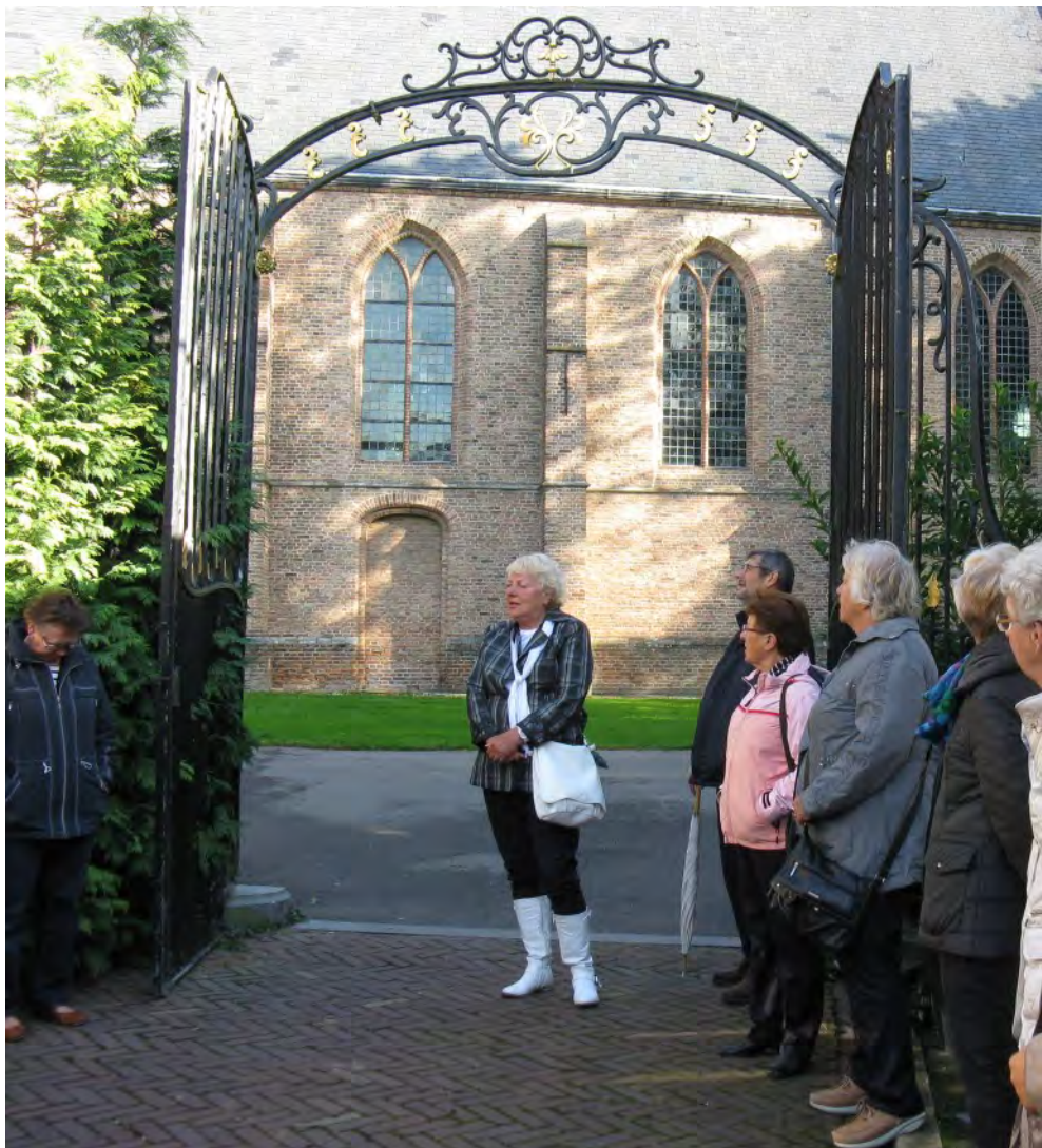
Els als gids tijdens een rondleiding in Mijnsheerenland