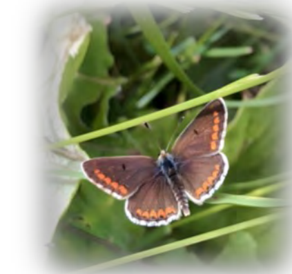
Bruinblauwtje