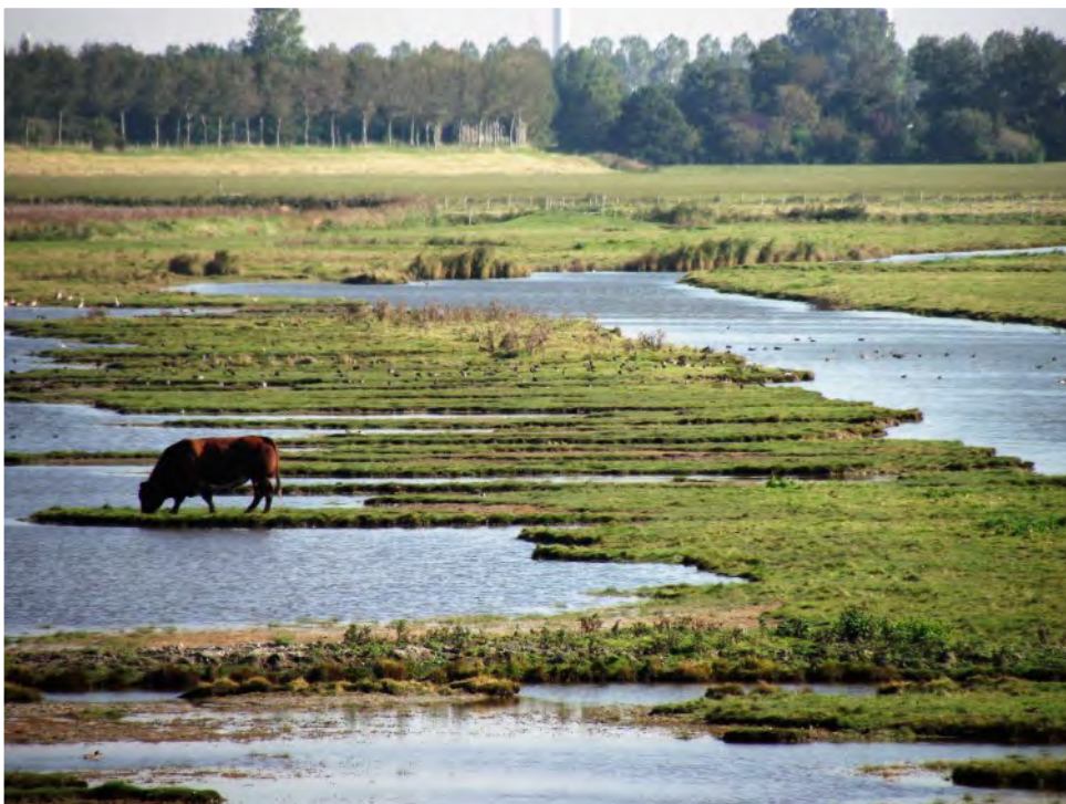
De Oude Dee bij Herkingen, kreek met overstromingsland en flexibel peil...