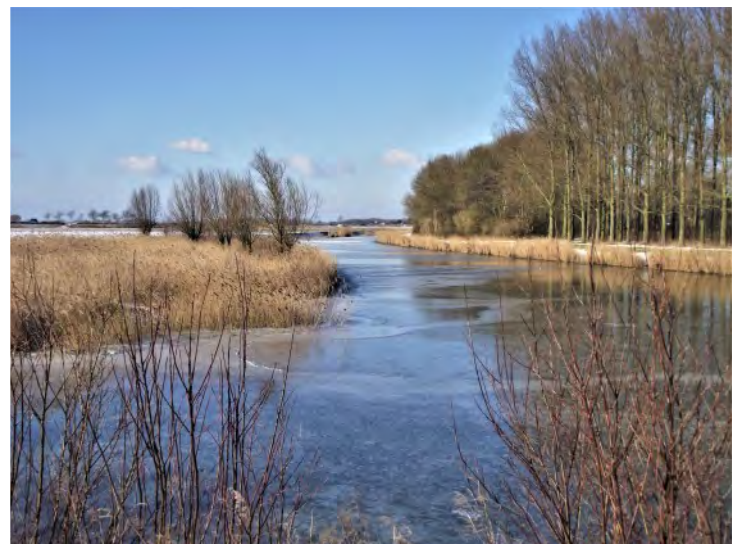
Het Piershilsche Gat in wintertooi...