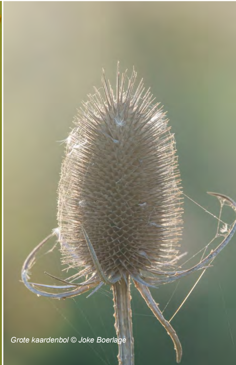
Grote kaardenbol