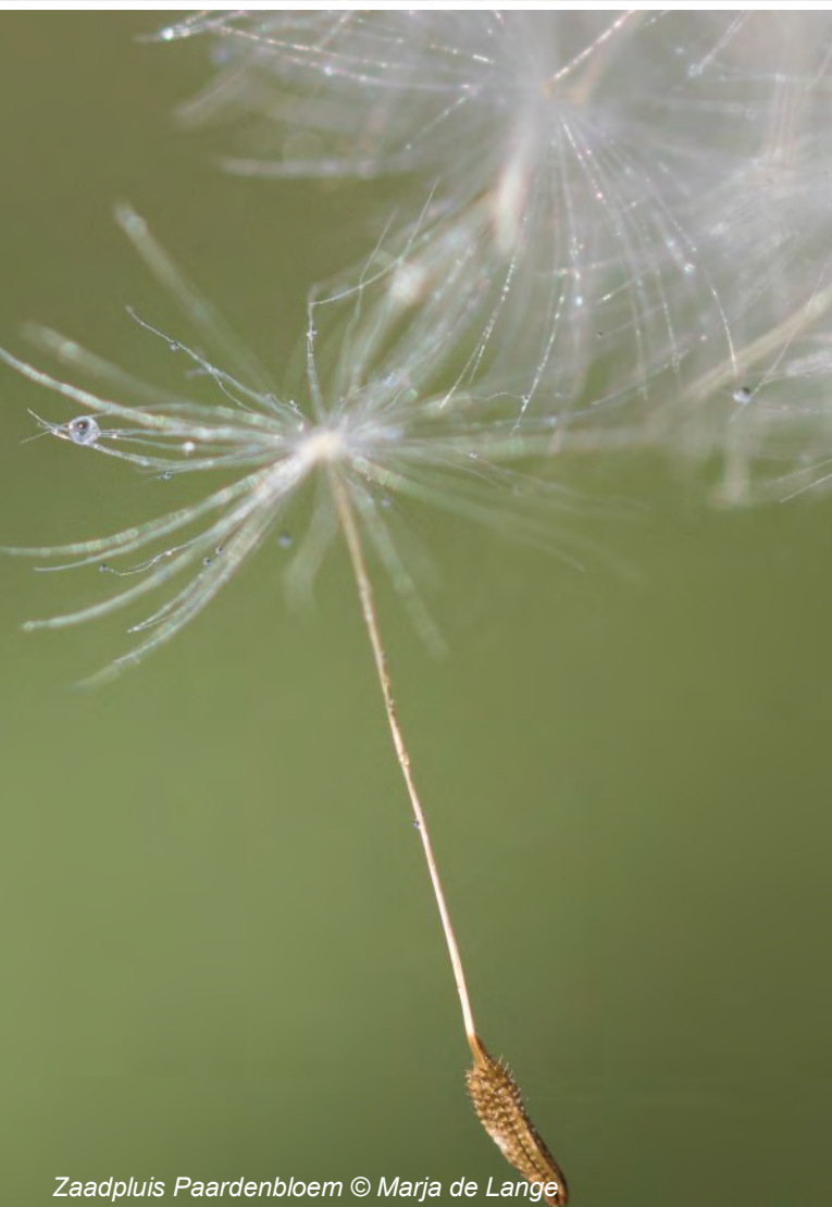
Zaadpluis Paardenbloem