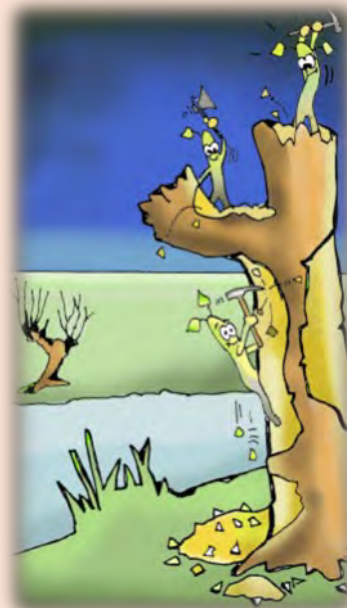
illustrator: Jan Breedveld

Zo'n eerste dag op een nieuwe plek is altijd spannend. Voelt de boom goed aan, kunnen we er goed komen, is de weg voor het molmafvoer goed begaanbaar, zijn er niet te veel gevaren onderweg en hebben we ruimte genoeg om te werken. We vertrekken van huis met al onze molmmaterialen of gereedschappen en sjouwen hiermee naar onze boom. De gereedschappen dragen we in tassen, manden of aan riempjes die we van de leerachtige zwammen hebben gemaakt die aan onze wilgen groeien. Deze zwammen zijn ons zeer behulpzaam bij heel veel zaken in ons dagelijkse leven. Zij dienen bijvoorbeeld als ze nog vers zijn en in de groei, in het najaar als zitbanken bij het feestelijk afsluiten van het seizoen. Daarna gaan we ze gebruiken voor een heleboel verschillende doeleinden. Hierbij moet je denken aan lekkere hangmatten om in te slapen, nieuwe laarsjes voor het hoge water, mooie rugzakken en draagriempjes voor onze gereedschappen. Zaak is wel, dat we dit allemaal in en op het mos bewaren zodat de substantie van de zwam soepel blijft. Als het hard wordt zal het materiaal breken en kunnen we het niet meer gebruiken. Het mooiste materiaal voor het opbergen van onze spullen is natuurlijk het Judasoor. Tassen, draagriempjes en laarsjes van Judasoor hoeven we absoluut niet ieder jaar te ver-