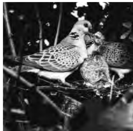
De Zomertortel is als broedvogel verdwenen uit de Hoeksche Waard.