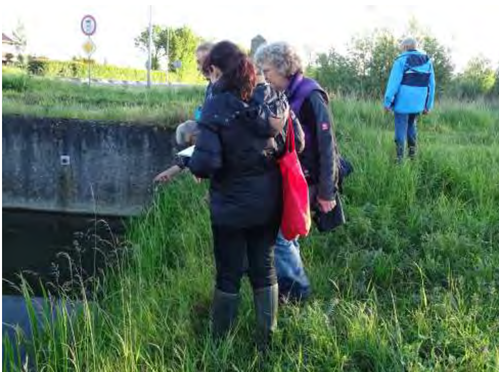
Met de inventarislijst in de hand kijkend naar een waterplant, natuurgebied Westmaas...

Is dat bij U, jou ook het geval, dan is het altijd mogelijk om één of meerdere keren in het zomerseizoen mee te gaan naar een gebied dat wij inventariseren en als het bevalt vaker mee te doen in onze werkgroep. Het is dan niet noodzakelijk uitgebreide kennis te hebben van de wilde planten.”