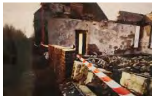
Klein Profijt: 'waardeloos' en 'aardig vervallen'...

“waardeloos” was geworden en aardig vervallen, werden de muren opgestroopt en het afval en puin opgeruimd. Vele containers afval en puin later en na een aantal tegenslagen (zoals een brand), kon aan de wederopbouw worden begonnen. Avond aan avond en elk weekend werd er door vrijwilligers hard gewerkt. Oude gebouwen werden afgebroken (Andersenhuis in Heinenoord) om met de materialen in Klein Profijt de boel weer op te bouwen. Met sponsoring van scholen en bedrijven en meer dan