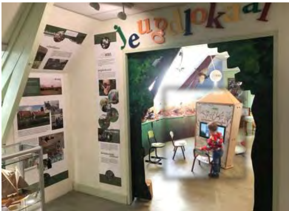
Educatieve les voor honderden kinderen in- en om het gebouw...

Er zijn ook grotere activiteiten zoals een markt of de Overloop (een drie-