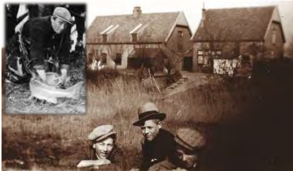
Zalmvissers op Klein Profijt, zalmvisserij begin 20ste eeuw...

12.000 uur klussen, werd in oktober 1995 het natuurbezoekerscentrum Klein Profijt geopend door de toenmalige commissaris van de Koningin van Zuid Holland. De droom van het HWL, een eigen bezoekerscentrum, was uitgekomen. In dit centrum konden vergaderingen, lezingen, educatie en cursussen gegeven worden. Bovendien zorgden de exposities en informatie ervoor dat de bewoners van de Hoeksche Waard meer kennis kregen over de schoonheid en het unieke karakter van ons eiland. Toen het natuurbezoekerscentrum