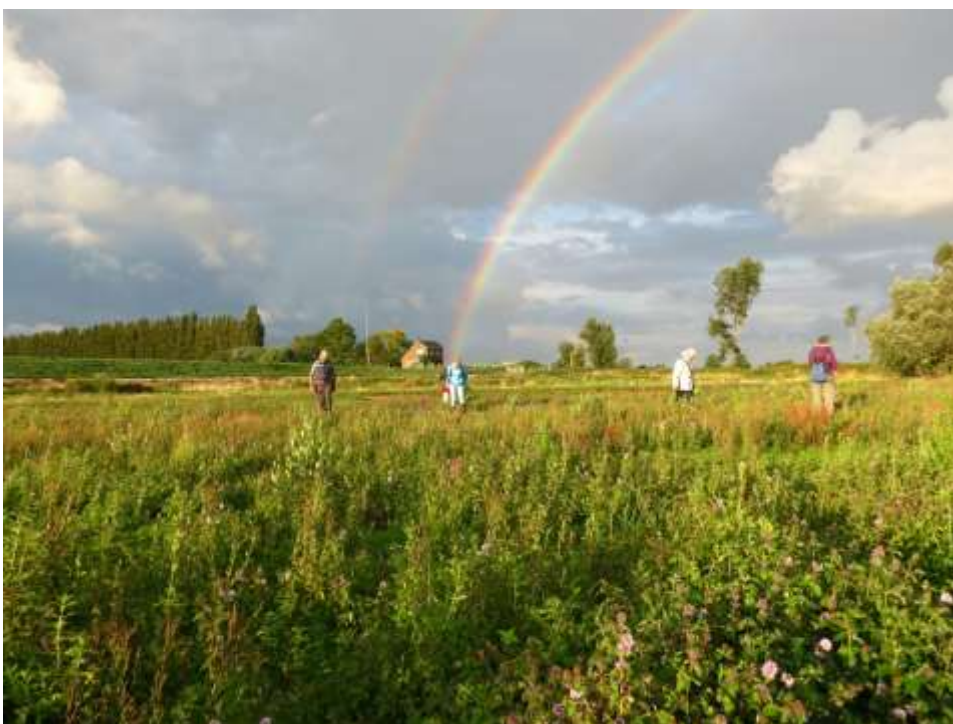
Symbool van onze Plantenwerkgroep 2002: Oost en West lijkt uit elkaar te lopen...