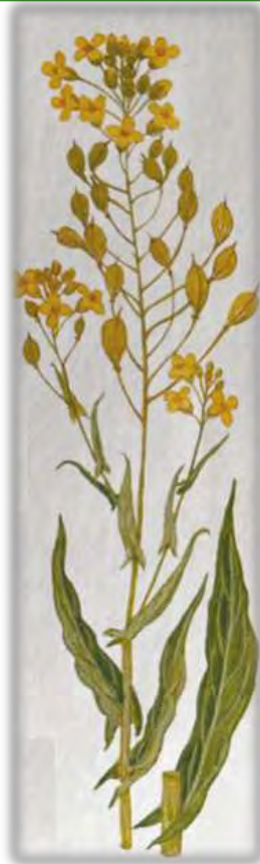
De Hutentut (Camelina sativa), een van de oudste cultuurgewassen in Nederland, ruim 25 jaar geleden ontdekt langs de N217...

Zelf ben ik bij de werkgroep planten terecht gekomen, omdat ik het leuk vond om ook in groepsverband met de wilde planten bezig te zijn, graag buiten ben en mijn kennis van de wilde planten wilde vergroten. Voor die tijd had ik altijd al belangstelling voor de wilde planten.