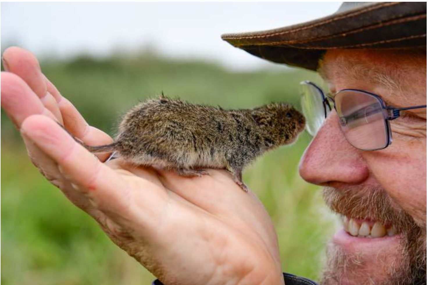
‘Liefde’ op het eerste gezicht....