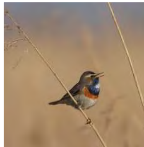
Blauwborsten waren in de voorbije halve eeuw uiterst welkome nieuwkomers.

Lees via de QR code verder op de website over: Vogelcursussen en 'In Vogelvlucht' Randstad en broedvogels Streekverlaters en nieuwkomers 2073?