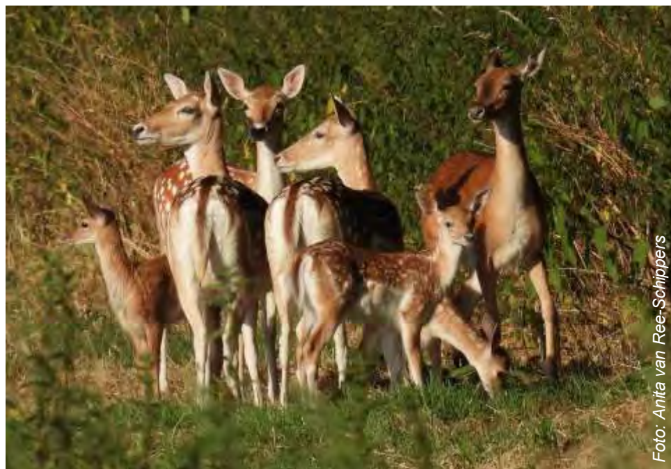
Vier hindses samen met drie kalfjes genietend in het zonnetje...

aanwinsten in de roedel. Wat het aantal nu op circa. 36 damherten gaat brengen. Nadat de Provincie begin dit jaar had besloten om niet in Hoger beroep te gaan, wat ook nadrukkelijk door alle politieke partijen die de motie