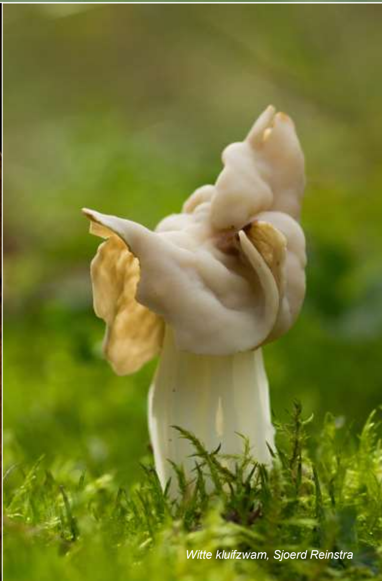
Witte kluifzwam, Sjoerd Reinstra