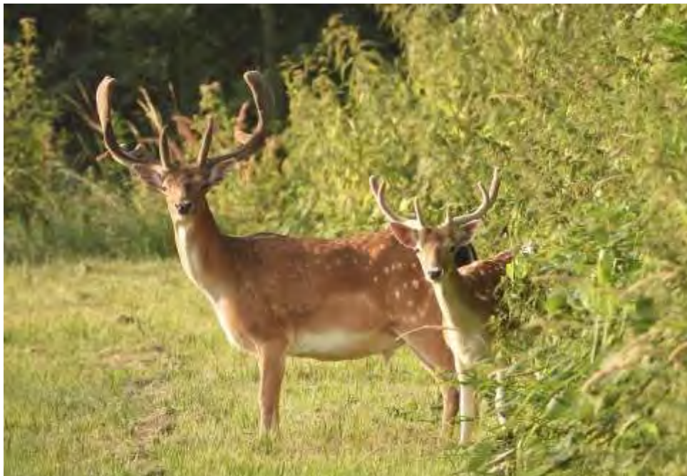
De oudste bok van de roedel die dit jaar verantwoordelijk was voor de nieuwe generatie, samen met een tweejarige nakomeling (Frits).

Nadat eind vorig jaar de rechter het besluit had genomen dat de roedel damherten niet mag worden teruggebracht naar de "0" stand is de rust teruggekeerd in de roedel. De roedel blijft zijn gebied trouw en is nog steeds alleen te vinden in het zuiden van de Hoeksche Waard.