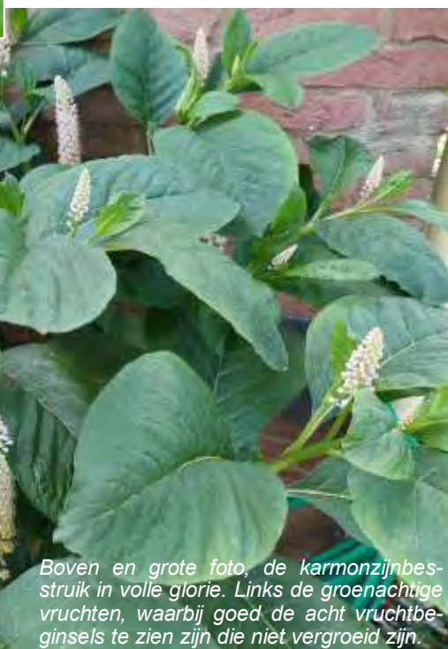
Boven en grote foto, de karmozijnbesstruik in volle glorie. Links de groenachtige vruchten, waarbij goed de acht vruchtbeginsels te zien zijn die niet vergroeid zijn.

Maar eerst bloeit de Oosterse karmozijnbes in juli en augustus met prachtige witachtige bloemen. Dit keer begon de struik door het zachte weer zelfs al in mei te bloeien. De lange bloemtrossen staan recht omhoog. De bloempjes worden bevrucht door insecten heb ik gelezen, maar die zie ik eigenlijk niet heel vaak op een bloemtros neerstrijken. Voor die prachtige bloemen en de zwart purperen bessen, die ik zo mooi vind en voor de vogels, laat ik een paar struiken in onze tuin staan, maar jonge struikjes verwijder ik meteen. Zijn de struikjes groter geworden, dan wordt dat een heel karwei, want de Oosterse karmozijnbes heeft wor-