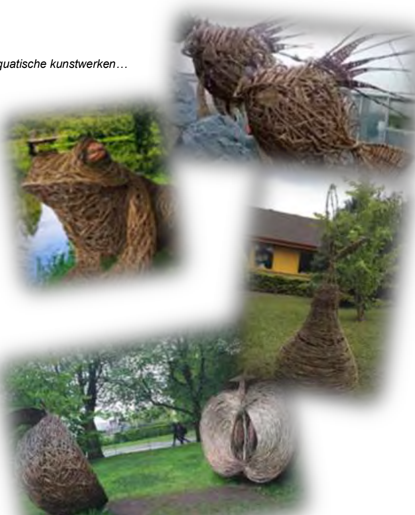
Kunstwerken van fruit...