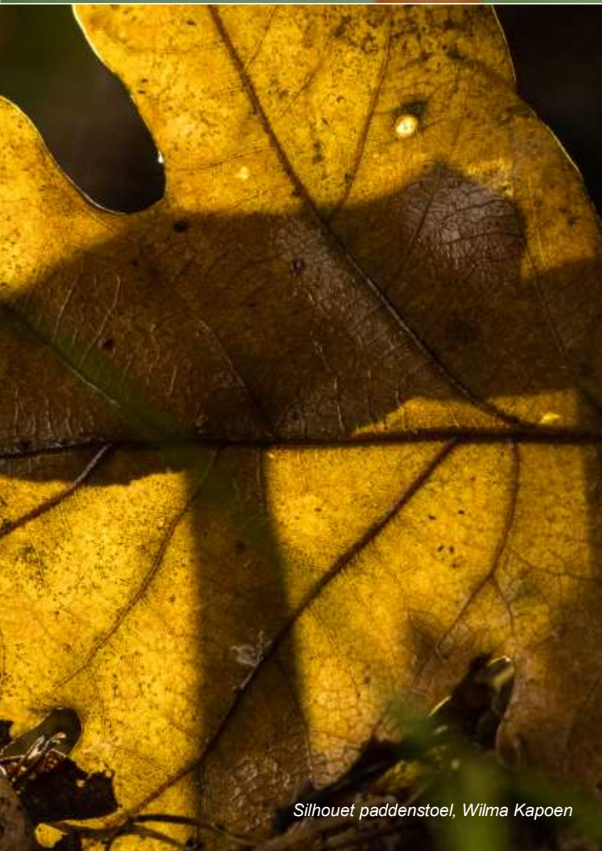
Silhouet paddenstoel, Wilma Kapoen