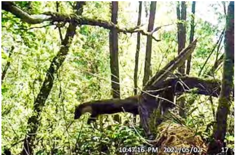
Een stilstaand beeld van de boomarter uit het filmpje van Nieck Alderliesten...

weten vanaf waar hij/zij is gekomen. Aannemelijk is dat het dier uit de populatie van de Biesbosch komt, maar nogmaals, niets is zeker.