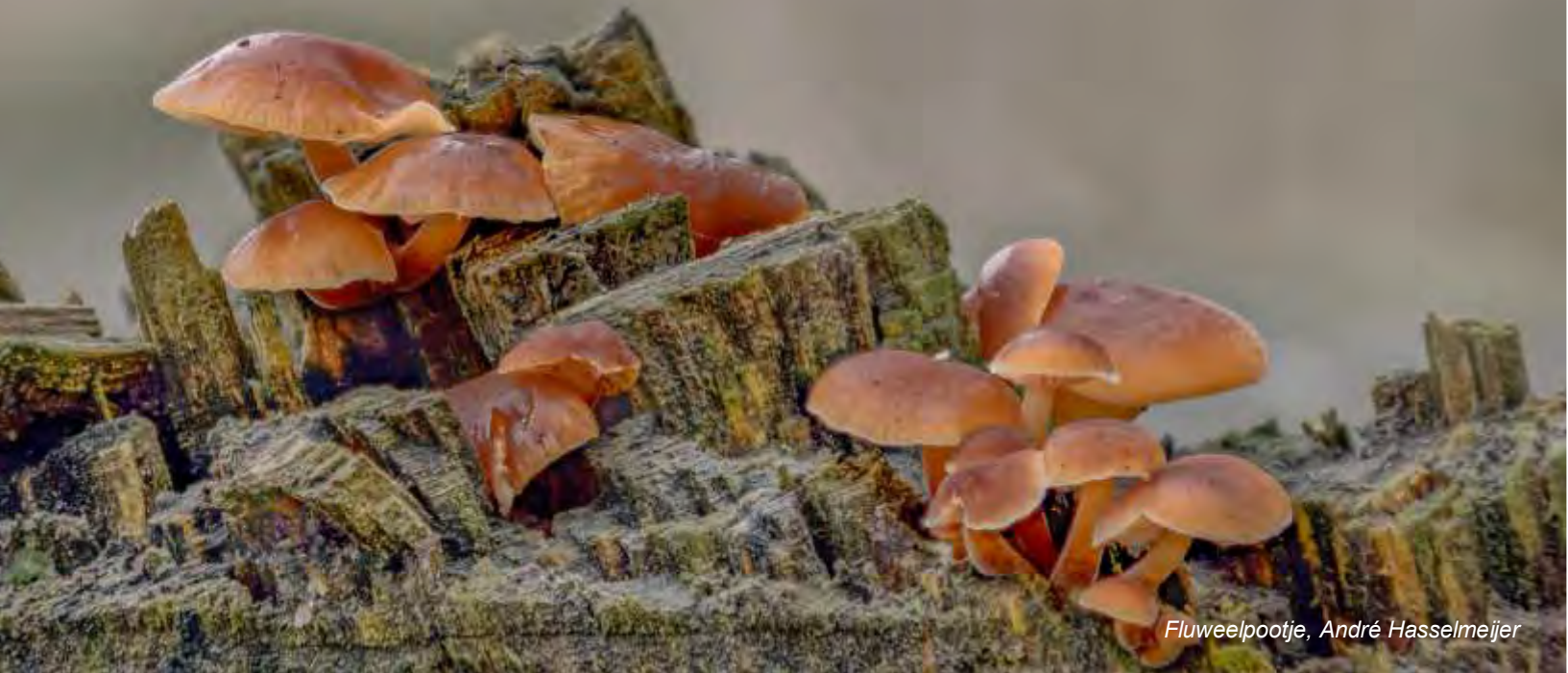
Fluweelpootje, André Hasselmeijer