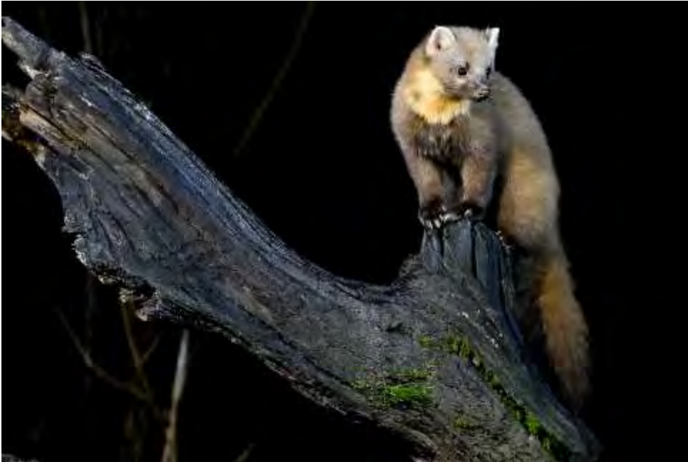
De boomarter in al zijn glorie. (niet het exemplaar wat in de Hoeksche Waard is gespot.

De opwinding was groot toen in 2018 voor het eerst een boomarter werd gezien op de Hoeksche Waard. “Op de Hoeksche Waard”, omdat het hier om een eiland gaat. Het dier zat in een natuurgebied aan de zuidkant van het eiland en werd gezien door Natascha Goemaeren.