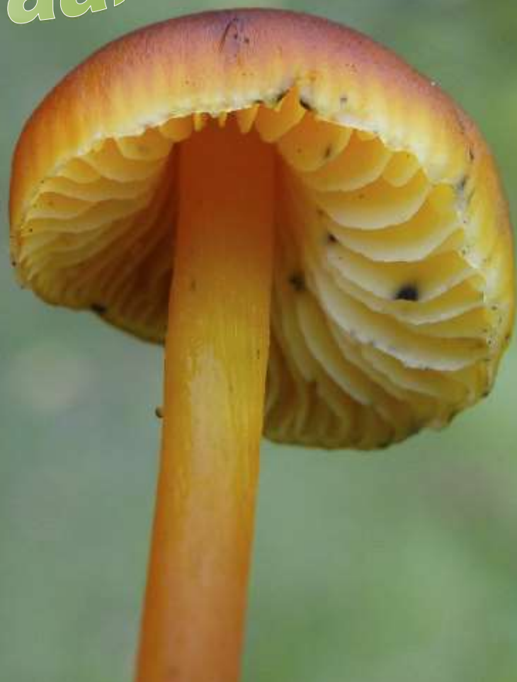
Zwartwordende wasplaat, Kitty de Zeeuw