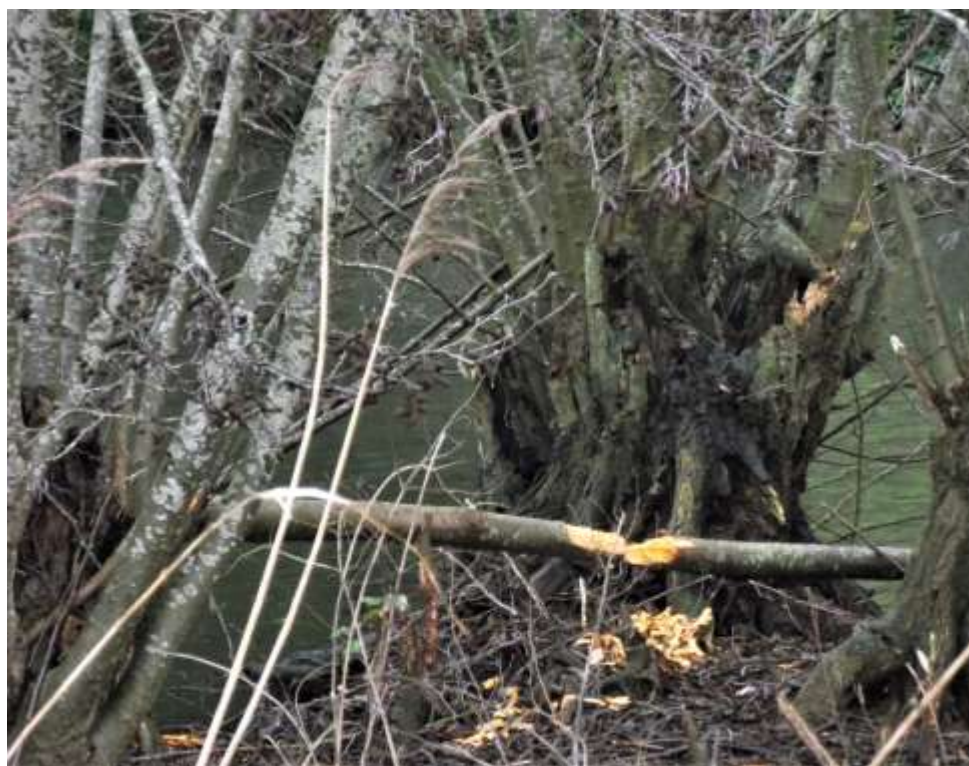
Duidelijk zichtbare sporen van een binnendijks bever...

een oude boomgaard. Een flink aantal fruitbomen is blijven staan. Bomen die geroid moesten worden, zijn grotendeels verplaatst naar een hoek van het nieuwe wijkje. Ze kunnen later herplant worden. We kunnen nu via de dijk en het dorp terug met een blik op het gors bij de molen. In de winter tref je daar steevast groepen meerkoeten, krakeenden, wilde eenden en smienten aan met geregeld wat wintertalingen, bergeenden en een enkele slobbeend. Voorts altijd aalscholvers, meeuwen, scholeksters, blauwe reigers en waterhoentjes. Soms watersnip en waterral. Echte deltasfeer met dat uitzicht!