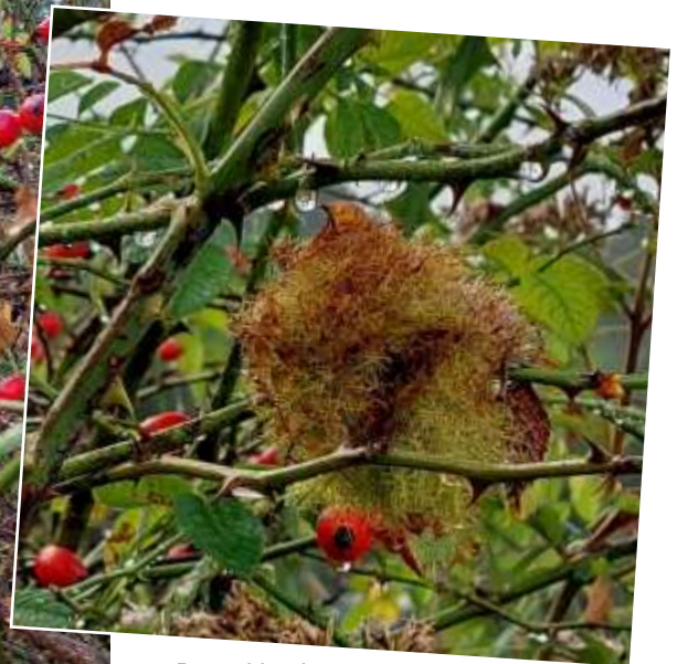
De gal in close up...

Sommige zagen er groen uit en hun grove structuur leek enigszins op mos. Andere waren groenbruin van kleur, met de zelfde structuur. Het meest opvallende aan de ballen was, dat ze bekleed waren met lange vertakte haren, een beetje lijkend op de hele smalle bladeren van de waterranonkel, die je ondergedoken kunt zien in een sloot met helder water. Toen ik ze van dichtbij bekeek, zag ik wel dat ze niet van mos gemaakt waren, maar ik had toen nog geen idee wat voor ballen het