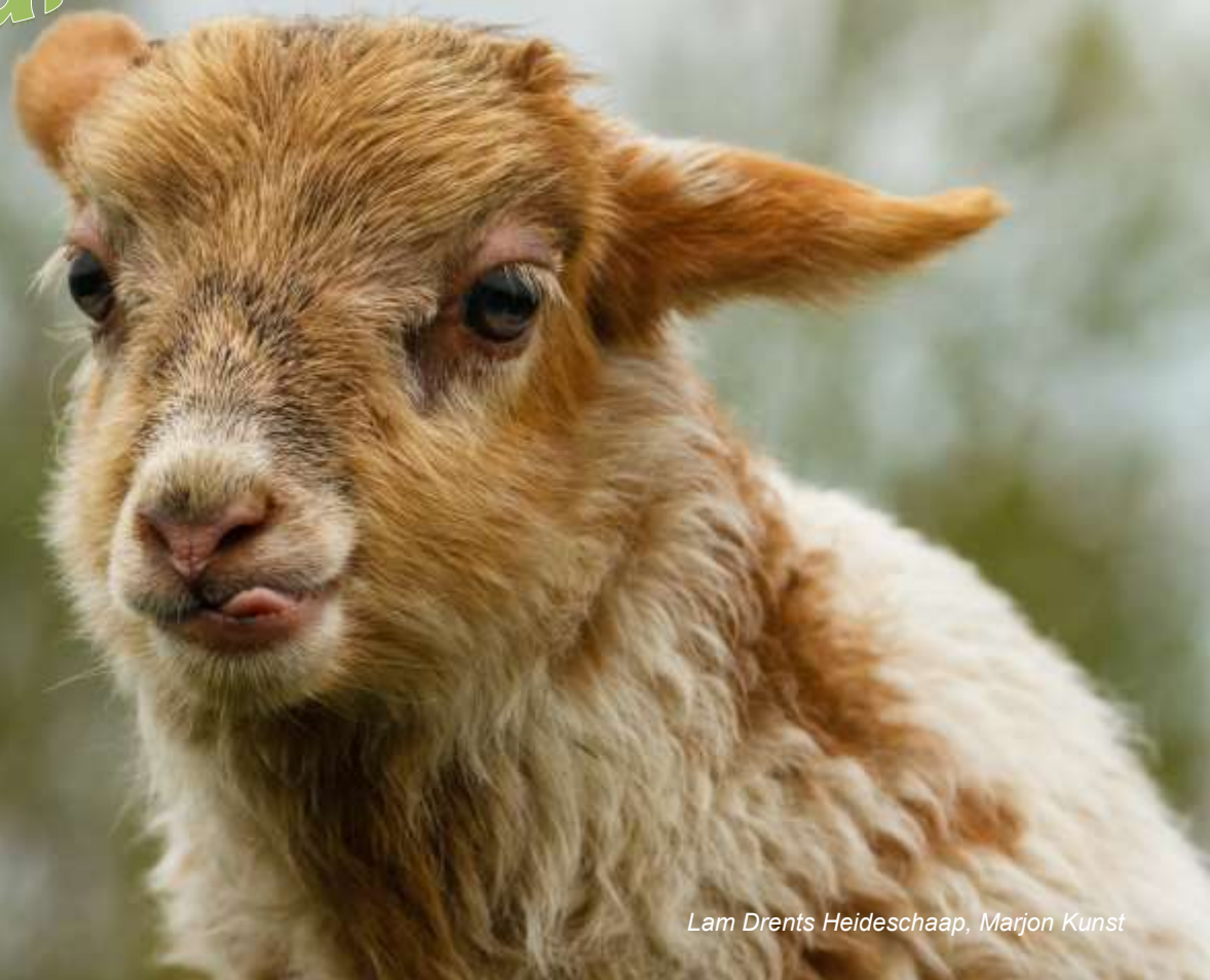
Lam Drents Heideschaap