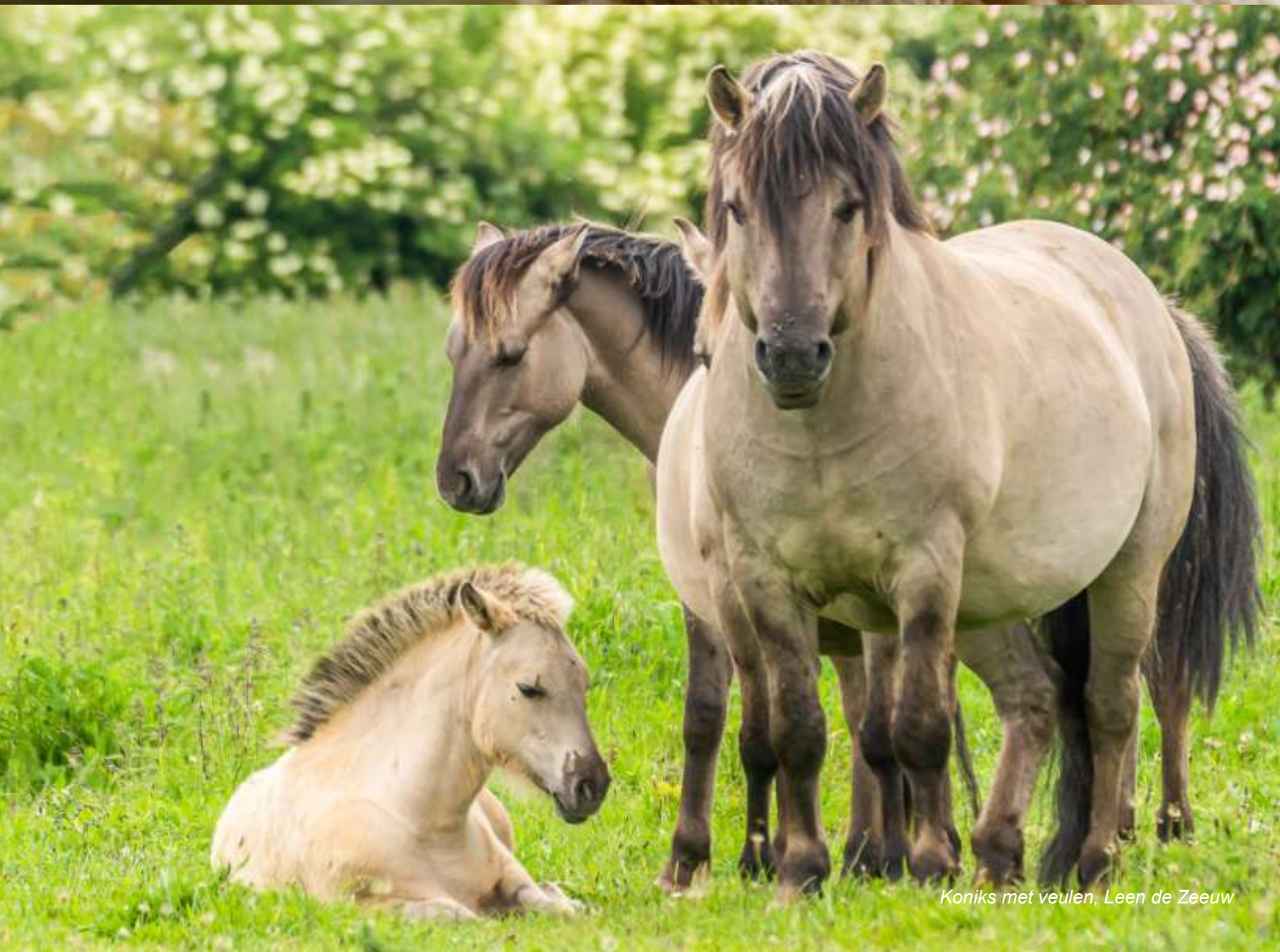
Koniks met veulen, Leen de Zeeuw