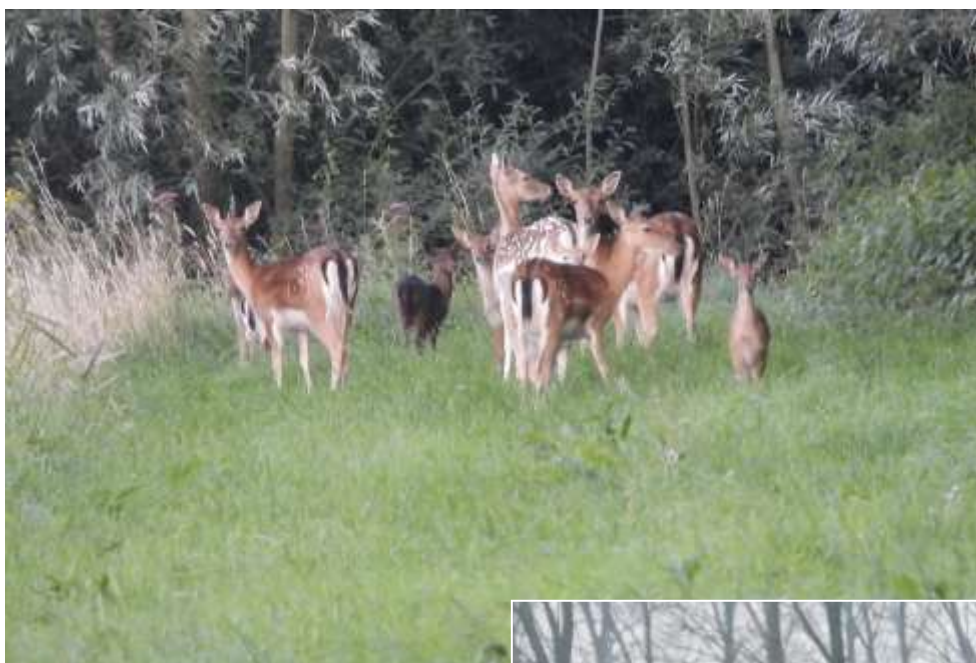
Hinde met kalfjes, juni 2021..