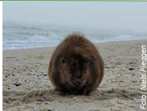
Bever op het strand...

Ik had ook niet verwacht dat er inmiddels boomarters in de polder leven en dassen in de duinen langs rivieren in het westen van het land. Otters zwemmen weer in de Delta (Zeeland