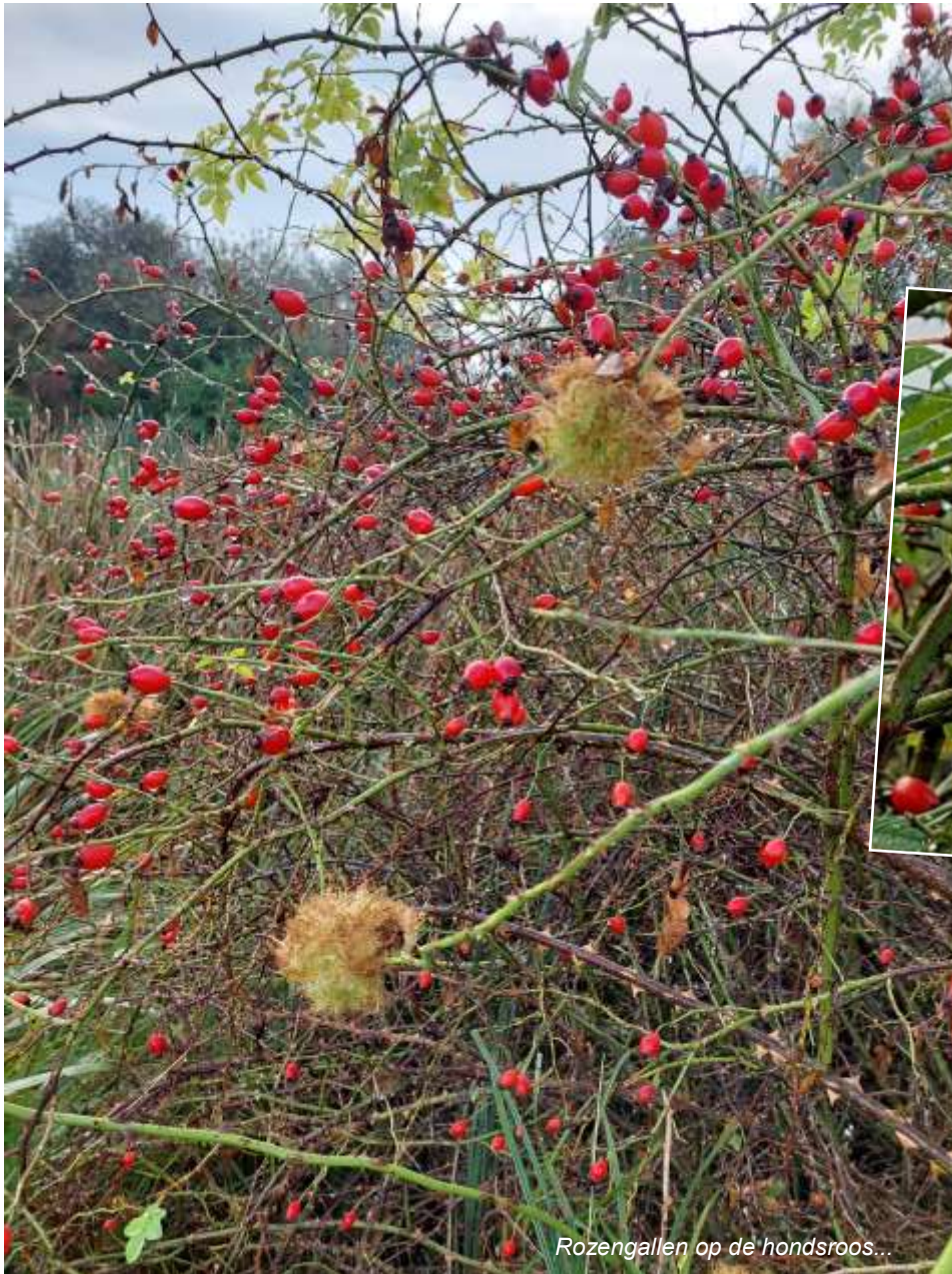
Rozengallen op de hondsroos...

Nadat ik de kerstballen net weer ingepakt had, dacht ik weer aan de ballen waar ik over zou willen vertellen in de Waardzegger. Ik ontdekte ze op één van mijn wandelingen langs de Boezemvliet bij Maasdam, op 14 september 2021, in een rozenstruik bij de waterkant.