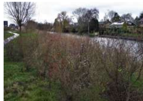
Rooie japen langs de Nieuw-Beijerlandse kreek...

Het pad voert ons tenslotte door de nieuwe bebouwing. Deze is gelegen in