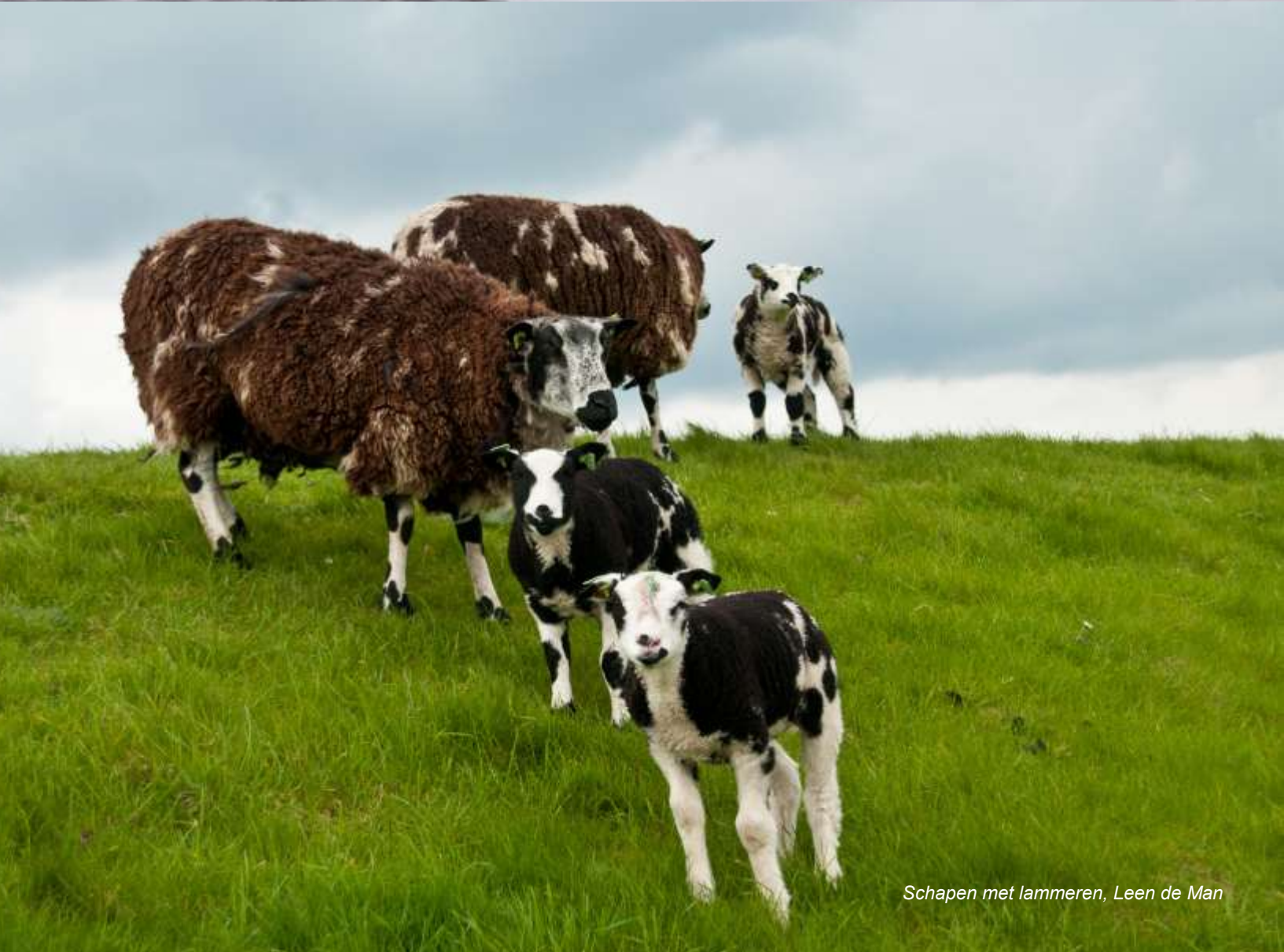
Schapen met lammeren, Leen de Man